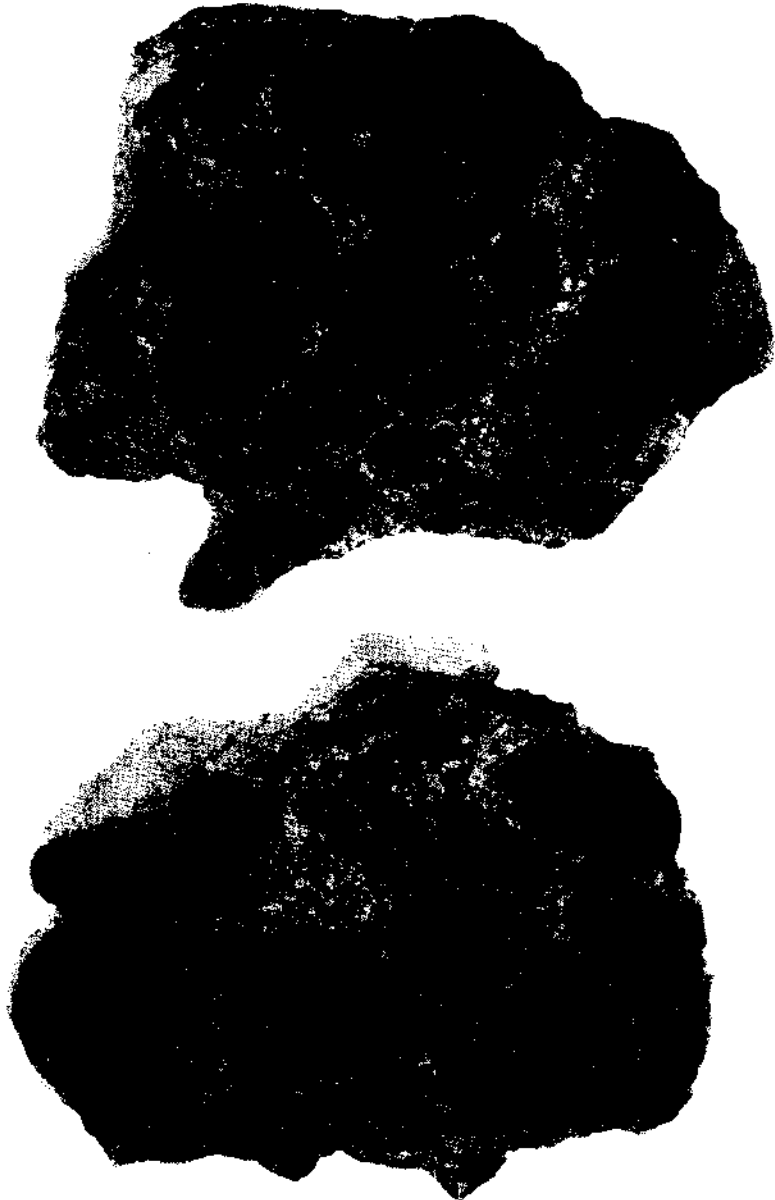
Abb. 1: Polierte Platten des Cordierit-Kugeldiorits von Häuslern bei Groß Gerungs, N.-O.