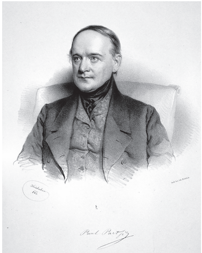
Abb. 1. Paul Partsch (1791–1856), Kustos und Leiter des k. k. Hof-Mineralienkabinetts.

Nachfolgend werden zunächst Absender (Partsch, Abb. 1) und Adressat des Briefes (Hörnes, Abb. 2) in der gebotenen Kürze vorgestellt. Zu Wilhelm von Haidinger, dessen Bedeutung unter anderem die Inschrift am Grabstein seines Ehrengrabs auf dem Wiener Zentralfriedhof – „ der Begründer des naturwissenschaftlichen Lebens in seinem Vaterlande “ – ausdrückt, sei auf die ebenso einschlägigen wie ausführlichen Nachrufe (HAUER, 1871; SCHRÖTTER, 1871) verwiesen. Selbiges gilt für Franz von Hauer, der zunächst am Montanistischen Museum wirkte, Haidinger 1849 an die Reichsanstalt folgte, hier 1866 dessen Nachfolger als Direktor wurde und 1885 als Intendant an das Naturhistorische Museum wechselte. Seine Karriere wurde durch seinen Schwiegervater, den Geologen Emil Tietze (1845–1931), anlässlich seines Todes umfassend dargestellt (TIETZE, 1900).