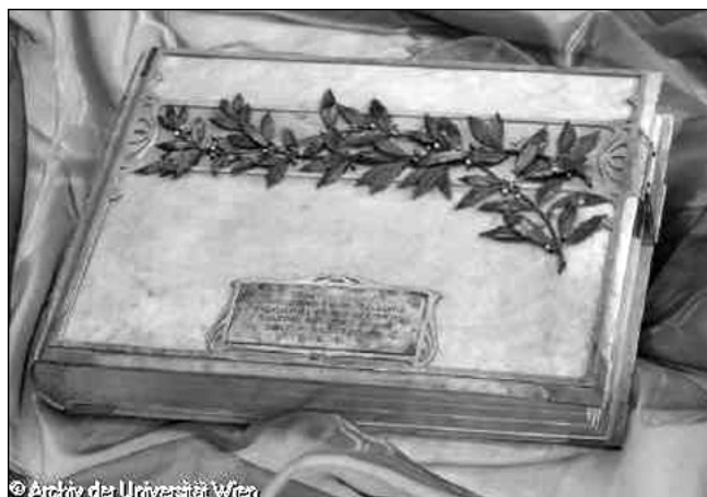
Abb. 1. Das Suess-Fotoalbum aus dem Archiv der Universität Wien.

falls in Silberprägung. Bei A. FÖRSTER, der nicht identifiziert werden konnte, handelt es sich höchstwahrscheinlich um den Hersteller des Albums. Die Rectoseite von Blatt 2 (fol. II r ) zeigt eine in Wasserfarben gemalte Berglandschaft, die Versoseite (fol. II v ) ist frei gelassen. Auf der Rectoseite von Blatt 3 (fol. III r ) ist ebenfalls in Wasserfarben eine Küstenlandschaft dargestellt. Die zweite bildliche Darstellung ist mit F. POLENDE 9) signiert.