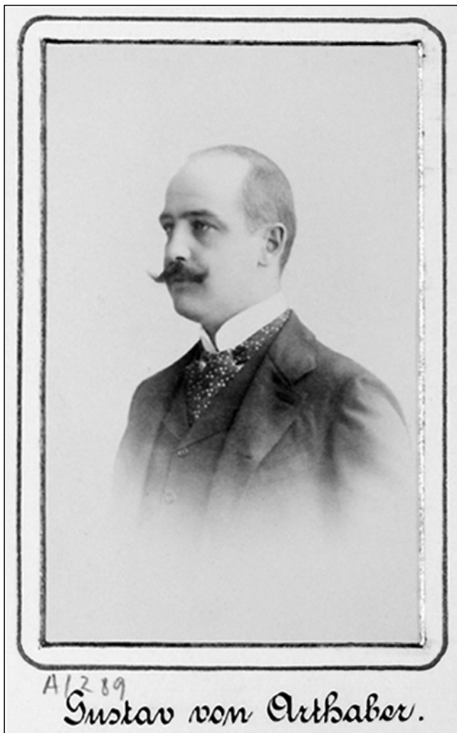
Abb. 2. Porträt von Gustav VON ARTHABER.