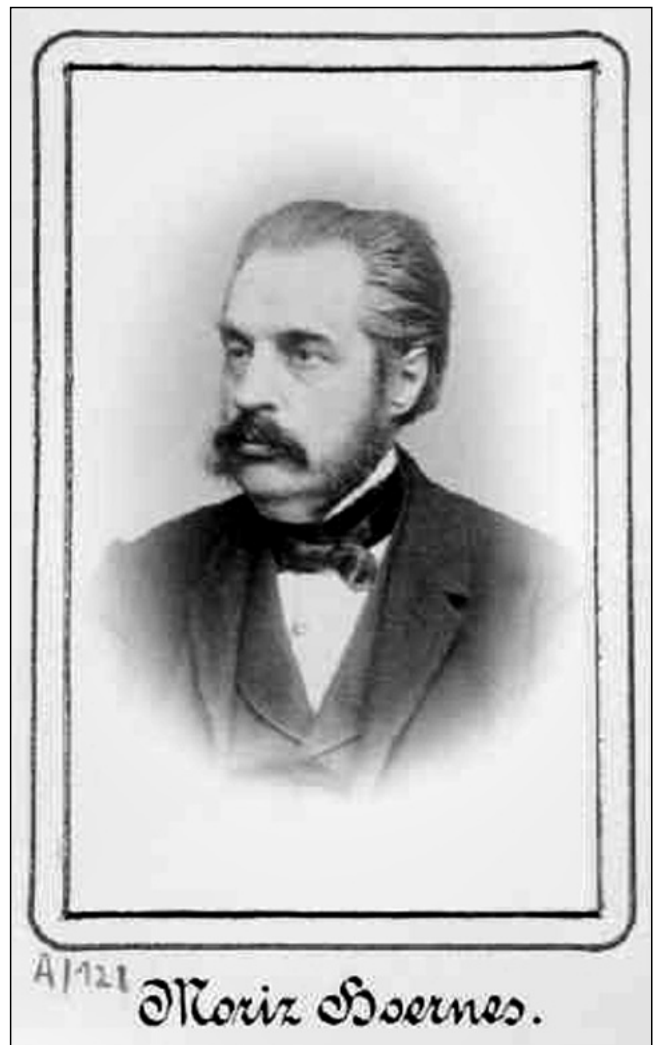
Abb. 3. Porträt von Moriz HOERNES.