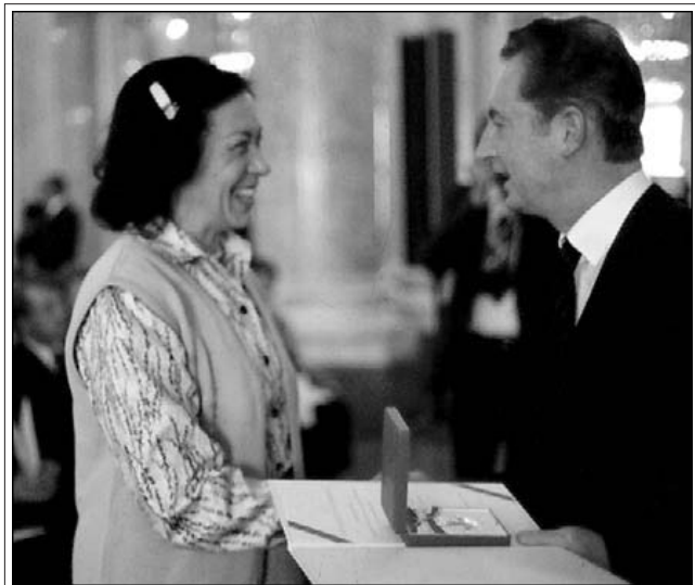
Feierliche Verleihung des Goldenen Verdienstzeichens der Republik Österreich am 3. März 1981 im Zeremoniensaal der Wiener Hofburg durch den Bundesminister für Inneres, Erwin Lanc.