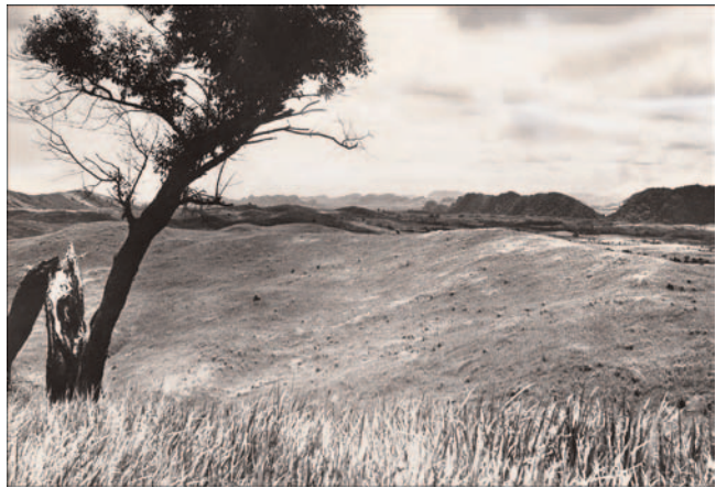
Im Meratos-Gebirge in Ost-Borneo. Die dunkle Kulisse bilden Lepidocyclinen-Kalke am Ostrand der Barito-Ebene, dahinter Metamorphikum mit Diamanten führenden Peridotiten.

Die drei Wochen dauernde Schiffsreise Genua – Port Said – Colombo – Belawan (Nord Sumatra), die Eindrücke im Roten Meer, im Indischen Ozean, am Edelsteinmarkt Colombo und schließlich die überwältigende Tropenvegetation um den Hafen an der Nordspitze von Sumatra ließen Europa langsam, aber vollstän-