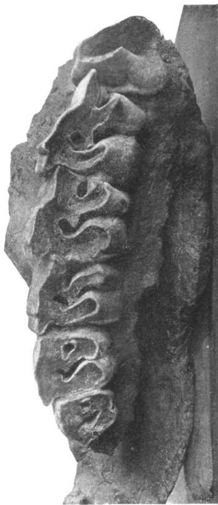
In zirka 1/2 natürlicher Größe.