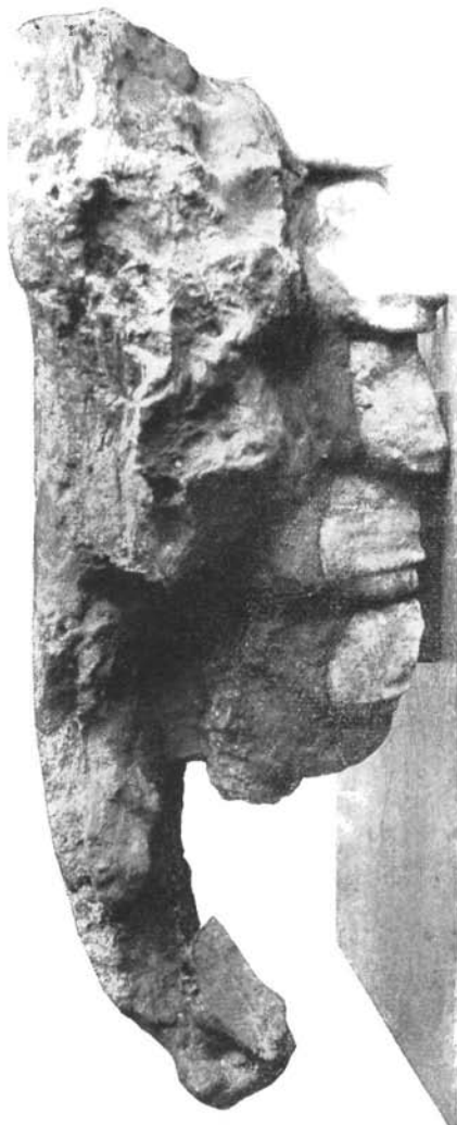
In zirka 1/2 \cdot 8 natürlicher Größe.