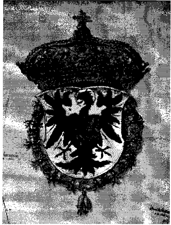
Abb. 4: Tiroler Wappen aus der Karte des Haller Salzberges von 1555

dem Eis zugefrorener Seen in natürlicher Größe wieder auftrug.