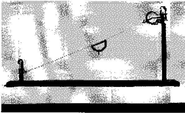
Abb. 3: Schinzeug aus der Mitte des 16. Jahrhunderts