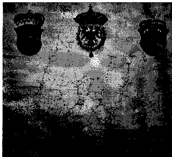
Abb. 5: Kopf der Karte des Haller Salzberges von 1555 mit Wappen

Als ausgesprochen bemerkenswert muß man die Versuche der Markscheider sehen, sich an den Rändern großer Karten künstlerisch zu betätigen.