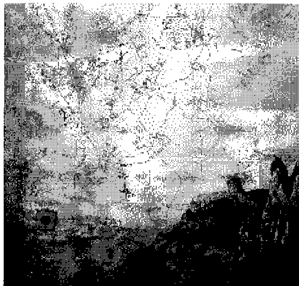
Abb. 6: Berglandschaft am Haller Salzberg aus der Karte von 1555

wie der Bergbau selbst im 18. Jahrhundert stagniert. In manchen Regionen kam er regelrecht zum Stillstand.