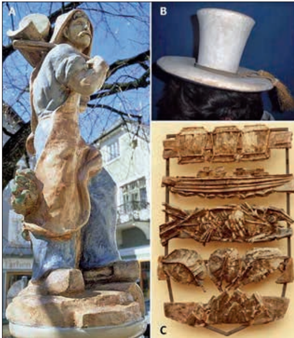
Abb. 15A: Salzträger als Keramik-Brunnenfigur am Rinnholzplatz

x) Auch das noch heute lebende Handwerk der Bootsbauer am Traunsee mit den gängigen Bootsformen „Plätten“ und „Schupfer“ geht auf die Tradition der Salzzillenbauer zurück. 26