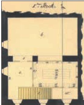
Abb. 11: Ausschnitt aus Beilage L von Riezinger (1867) mit dem Titel „Plan Uiber das Fuderlsalz-Magazin auch Salzaufschüttgenant, des k.k. Salz Verschleiß-Magazinsamtes Gmunden, im Rathause der Stadt

Wasch- und Holzhitte des Magistratsgebäudes. 32. Eingang zur städtischen Wage. 33.-40. Hölzerne Säulen auf einer steinernen Unterlage mit einem Blechdach versehen, zum Fuderlsalz herrichten und aufladen für die Eisenbahnwagen und Bruchsalzpartien bei Regenzeit. 41. Eisenbahn.“