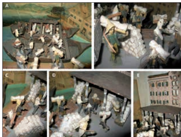
Abb. 9B: Am links im Vordergrund gehenden Fudertrager sieht man die Ausrüstung der Salzträger: ein aus Leder gefertigter Fudersack schützt den Nacken vor dem ätzenden Salz, das Tragerl, eine aus Holz gefertigte Hohlrinne, dient zur Aufnahme von je 3 Fuder, und der Knüttel, eine, einem Spazierstock ähnliche Holzstange dient zum Balancieren des Getragenen