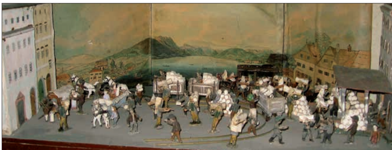
Abb. 1: Diorama vom Salzumschlag am Stadtplatz von Gmunden; naturalistisches und aquarelliertes Panorama der Landschaft rund um den Traunsee, Häuserfassaden aus Pappkarton sowie ca. 50 handgeschnitzte und gefasste Holzfiguren.

Vor allem die im genannten Diorama gezeigten Szenarien erwecken die Zeit annodazumal quasi zum Leben. 5 So geben die darin dargestellten Figuren einen äußerst lebendigen Einblick in die tatsäch-