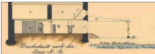
Abb. 12: Profilschnitt entlang der Linie A-B auf der Beilage L von Riezinger (1867) mit dem Titel „Plan Uiber das Fuderlsalz-Magazin auch Salzaufschüttgenant, des k.k. Salz Verschleiß-Magazinsamtes Gmunden, im Rathause der Stadt Gmunden“ und dem Originaltext „Erklärung des Durchschnittes: 1. Eingang in das Fuderlmagazin. 2. Eingang in die Kanzley. 3. Kaminthür. 4. Platz für die Fuderl mit 30 Pfund. 5. Bergkernkammer. 6. Lokal für die Fuderl zum ausgleichen. 7. Requisitionskammer. 8. Hausthor. 9. Und 10. Hölzerne Säulen mit Blechdach zum Fuderlsalz herrichten u. verladen bei Regenzeit. 11. Das Wasser muß von untersten Uferstreichbaum um 1° 1' steigen, bis selbes in das Fuderlmagazinkömmt.“ Des weiteren steht unter der Skizze rechts: „Unterster Uferstreichbaum“ darunter „Gewöhnlicher Wasserstand des Gmundner Sees“ und darunter:

Gmunden“ und dem Originaltext „Erklärung des 1 ten Stockes: 1. Stiege vom Erdgeschoß in Iten Stock. 2. Vorhaus. 3. Platz für die Fässer zum Bergkernschotter einfüllen. 3. Platz für das Kanzleisalz. 4. Eingang in die Bergkernkammer. 5. Bergkernkammer. 6.-24. Plätze für die Fuderl zum ausgleichen zu 18 Pfund bis 27,5 Pfund, 25. Requisitionskammer.