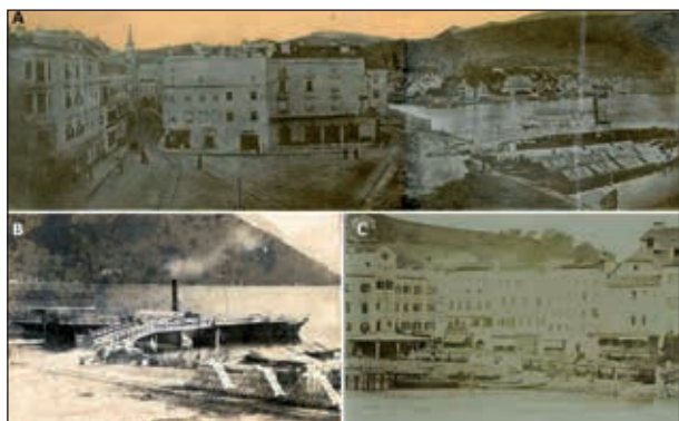
Abb. 8A: Panorama vom Dach des Gmundner Rathauses nach Osten über den Rathausplatz mit den Gleisanlagen der Pferdeisenbahn, den Salzkobeln und dem Dampfer Elisabeth für die Personenschiffahrt

18 Wägen aufgestellt werden. Drei Fotos aus dem Archiv der Kammerhof Museen Gmunden dokumentieren dies eindrucksvoll ( Abb. 8A-C ).