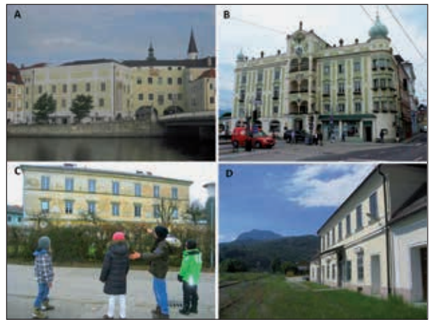
Abb. 14A: Das Kammerhofgebäude an der Gmundner Traunbrücke – Sitz der Kammerhof Museen Gmunden und des Gmundner Stadtarchivs