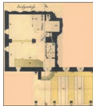
Abb. 10: Ausschnitt aus Beilage L von Riezinger (1867) mit dem Titel „Plan Ueber das Fuderlsalz-Magazin auch Salzaufschüttgenant, des k.k. Salz Verschleiß-Magazins amtes Gmunden, im Rathause der Stadt Gmunden“ und dem Originaltext „Erklärung des Erdgeschosses: 1. Eingang in das Fuderlmagazin. 2. Eingang in die Kanzley. 3. Kanzley. 4. Schreibtisch. 5. Platz für den k.k. Kontrollor. 6. Platz für den k.k. 2ten Offizial. 7. Platz für den k.k. 2ten Assistenten. 8. Aufgangsstiege in den 1ten Stock. 9. Kamin. 10. Retirade. 11. Platz für die kleine Sorte Fuderl unter 30 Pfund. 12. Platz für Fuderl mit 30 Pfund. 13. Platz für größere Sorte Fuderl über 30 Pfund. 14. Platz für das Zentner Salz, 3 Fuderl = 1 Zentner. 15.-29. Platz für die Fuderl zum ausgleichen zu 28 bis 36,5 Pfund. 30. Platz für das Bruchfuderlsalz. 31. Eingang zu

Des weiteren ist dieser Plan-Beilage L zu entnehmen, welche Räume im Gmundner Rathaus angemietet waren bzw. wie diese zur Verwendung standen. Die nachfolgenden, auszugsweisen Abbildungen aus dem Plan sollen dazu einen kurzen Einblick geben (Abb. 10, 11, 12).