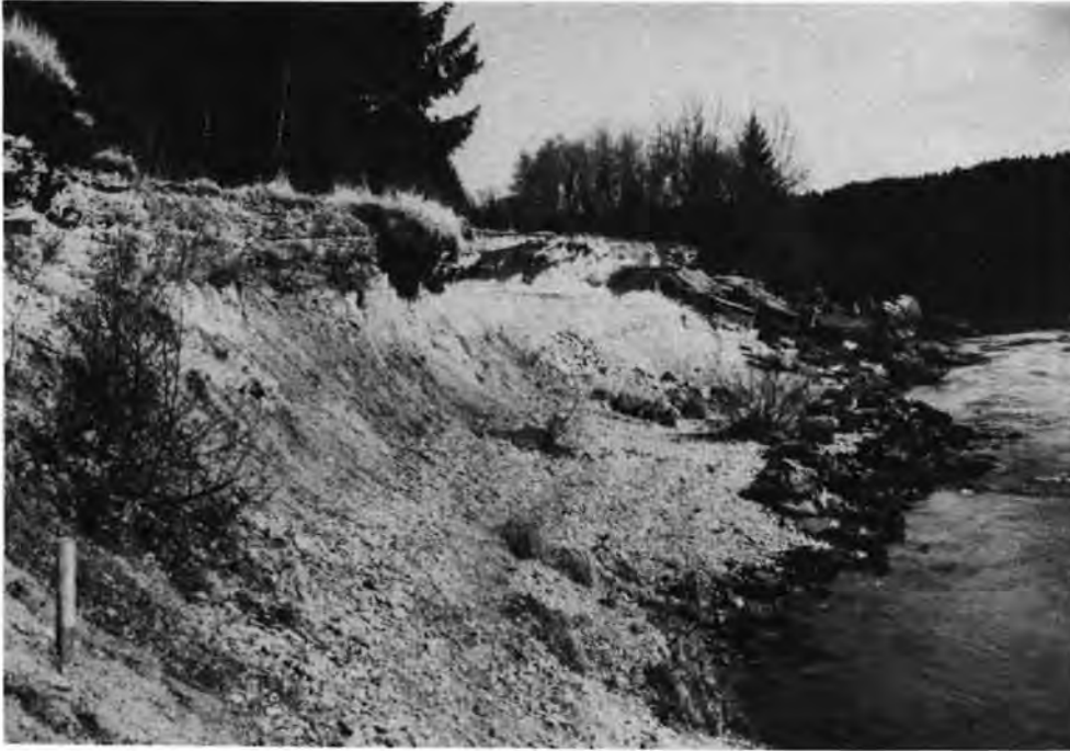
Abb. 1: Aufschlußprofil in den Kalksinterbildungen am linken Lechufer östlich Hurlach.