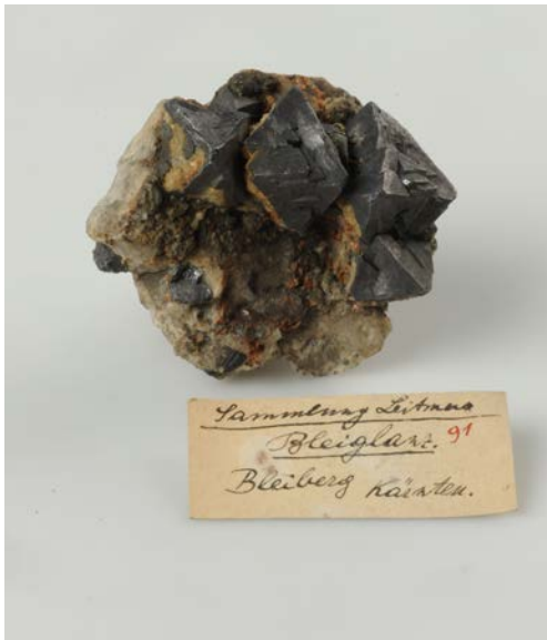
Abb. 6 Galenit, Bleiberg, Kärnten aus der Sammlung H. Leitmeier (NHMW, N8893; 6x5.5x4.5 cm), Foto: A. Schumacher, NHMW