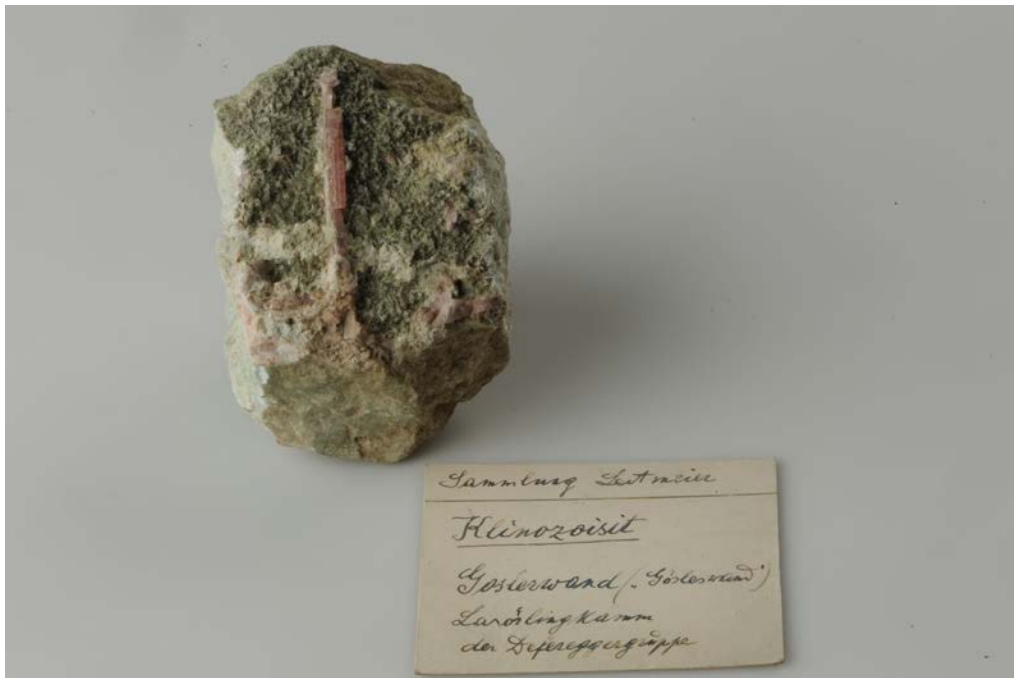
Abb. 5 Klinozoisit, Göseswand, Prägraten, Osttirol aus der Sammlung H. Leitmeier (NHMW, N8995 ).