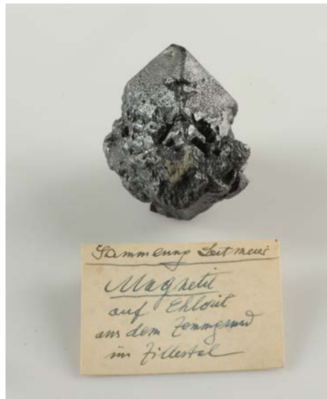
Abb. 7 Magnetit, Zemmgrund, Zillertal, Tirol aus der Sammlung Leitmeier (NHMW, N8927; 4.8x5.1x2.7 cm), Foto: A. Schumacher, NHMW