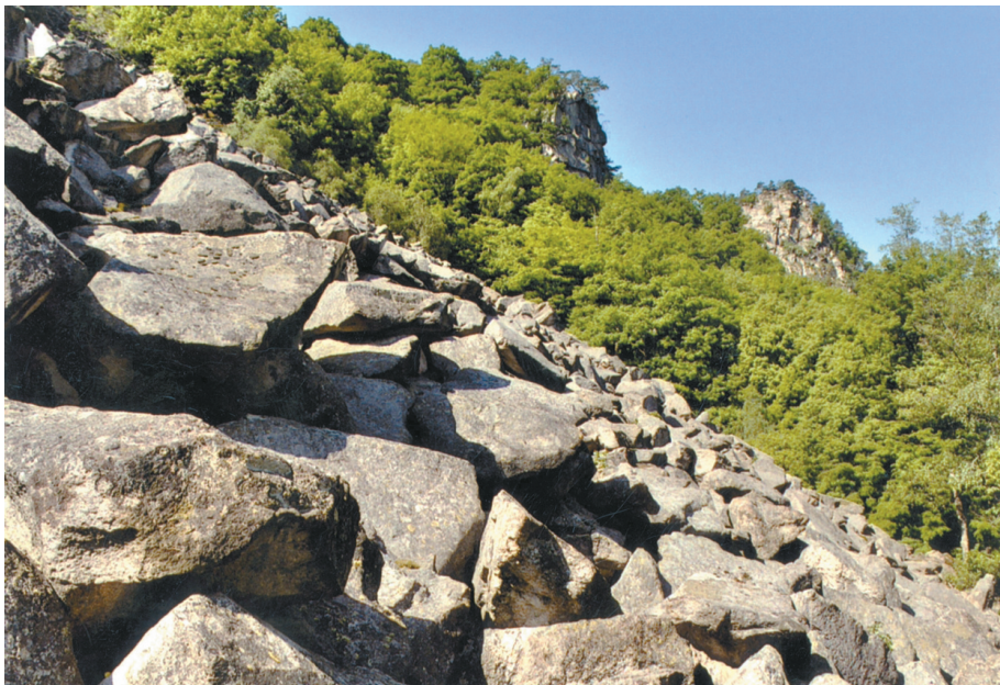
Abb. 3: Blockfeld beim Kirchenwald im Südosten des Nationalparks. Darüber die Abbruchwände im Thaya-Granit.

An der Waitzendorfer Störungszone, die zwischen Pulkau und Znojmo die Böhmisches Masse gegen die Alpin-Karpatische Vortiefe (Molassezone) begrenzt, sind die Gesteine in manchen Bereichen durch laterale, sinistrale (linksseitige) Bewegungen an der Störungszone ebenfalls kataklastisch zerbrochenen und zerrienen.