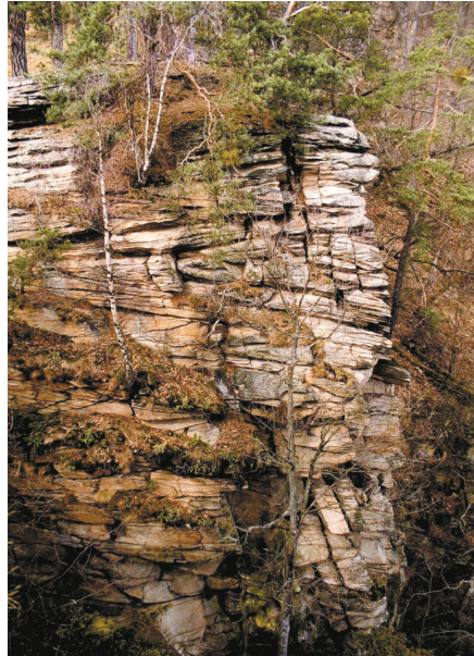
Abb. 5: (a) Glimmerschiefer der Pernegg-Gruppe im Bachbett des Ochsengrabens (links). (b) Turmfelsen im Bittescher Gneis südöstlich vom Stierwiesberg (Býčí hora) (rechts).

Als höchste strukturelle Einheit des Moravikums folgt über der Pernegg-Gruppe die Bittesch-Einheit mit dem Bittescher Gneis als Leitgestein. Dieses Gestein, das