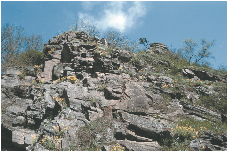
Abb. 4: Therasburger Gneis (intermediärer Orthogneis) am Überstieg beim Umlaufberg.

Struktur. In der feinkörnigen Grundmasse, die hauptsächlich aus dunkelbraunem Biotit und Quarz, untergeordnet aus Muskovit und Zirkon besteht, finden sich größere Feldspat-Einsprenglinge aus perthitischem Orthoklas und Plagioklas (BATÍK et al. 1993). Der intermediäre Orthogneis kann als Abkömmlinge von granodioritischen bis dioritischen Gesteinen angesehen werden. Nach FUCHS (1993) ist er wahrscheinlich ein Äquivalent des Therasburger Gneises (HÖCK 1991) im Süden auf Blatt Horn. Es ist ein plattig-bankiger, blockig verwitternder Gneis mit gut ausgeprägter, Nordost-Südwest verlaufender Lineation (FUCHS 1993, 1995, 1999). Der granodioritische Gneis ist vom Umlaufberg durch den Schwarzwald nach Merkersdorf zu verfolgen. Er ist besonders gut am Umlaufberg zu studieren, wo er am Überstieg unterhalb des Aussichtsplateaus, am Weg zum Umlauf, wandförmig aufgeschlossen ist (Abb. 4; FUCHS 1999).