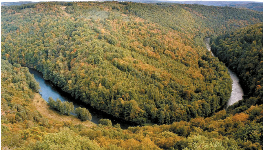
Abb. 1: Talmäander der Thaya beim Stierwiesberg (Býčí hora) südöstlich von Vranov nad Dyjí.

Der grenzüberschreitende Nationalpark Thayatal-Podyjí liegt am Ostrand des Waldviertels, an der Grenze zum Weinviertel und gehört zur Böhmisches Masse, einer der geologisch ältesten Teile Österreichs und auch Europas. Wie in kaum einem anderen Teil Österreichs blieben Gesteine aus so weit auseinander liegenden Epochen der Erdgeschichte nebeneinander vereint. In der viele hundert Millionen Jahre dauernden geologischen Geschichte können mehrere Phasen unterschieden werden, die in den Gesteinen dieses Gebietes noch zu erkennen sind. Die wohl wichtigsten in der Entwicklung der Gesteine sind zwei große Gebirgsbildungsphasen, die vor ca. 600 Millionen Jahren (cadomische Gebirgsbildung) bzw. vor ca. 340 Millionen Jahren (variszische Gebirgsbildung) stattfanden und bei denen große Kettengebirge mit Hochgebirgscharakter entstanden. Nach jeder Gebirgsbildung folgte eine mehrere hundert Millionen Jahre dauernde Abtragungs- und Einebnungsphase. Oftmals wurde das Gebiet von Meeren überflutet; von einer Meeresbedeckung vor rund 20 Millionen Jahren sind noch Spuren im Umkreis des Nationalparks erkennbar. Erst vor ca. 5 Millionen Jahren begann die Eintiefung der heutigen Flüsse und damit auch die Entstehung des Thayatales. Vor allem die „Eiszeiten“, der mehrmalige Wechsel von Kalt- und Warmzeiten im Pleistozän, hinterließen deutliche Spuren und prägten das heutige Landschaftsbild des einmaligen Tales der Thaya (Dyje) (Abb. 1).