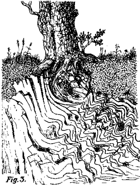
Nah der Hangendgrenze der „unteren Schiefer“.

Diese Kalke entsprechen daher den Barrandei-Schichten des Grazer Paläozoikums aus dem oberen Unterdevon bis unteren Mitteldevon.