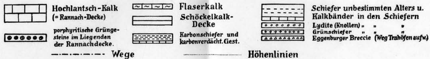
Abb. 1. Geologische Aufnahme des Rechberg, Fragnerberg-Gebietes.