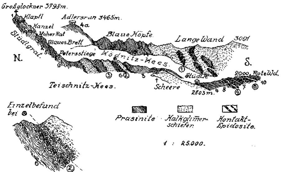
Fig. 1. Glocknerprofil über dem Stüdlgrat.

Dasselbe ist am Kleinglockner zu sehen, auf den Felsen der Adlerruhe, im Kamm der Blauen Köpfe und in der Langen Wand. Das