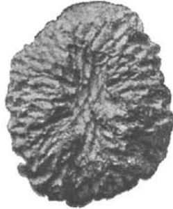
Sternform, Mohelno? bei Mähr.-Kromau.

so verbreitete Typus der „Sterne“ (Fig. 3). Von der Mitte des Stückes strömen längliche „Ausbrennungscanäle“, sich manchmal auch