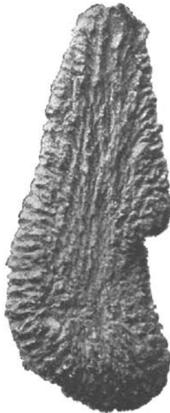
Tropfenförmig ausgezogene Form. Moldauthein. (Sammlung des nat. Hofmuseums.)

verzweigend, gegen die Ränder; in der Nähe der Ränder wird die strahlenförmige Anordnung immer deutlicher, und der Rand selbst, wo die Canäle von beiden Seiten zusammenfliessen, erscheint quer