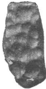
Kernstück mit „Fingereindrücken“. Slawitz bei Trebitsch. (Coll. Hanisch.)

„Obsidianbomben aus Niederländisch-Indien“, in welcher der Verfasser zu ebenderselben Deutung für die manchen Moldavitoberflächen ganz ähnlichen Sculpturen der genannten Körper ganz selbständig gelangt ist.