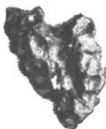
Stark corrodirt Form. Kožichovic bei Trebitsch. (Coll. Hanisch.)

wo die erweichte Glasmasse zuert beiseite geschoben und entfernt worden war, hat sich der heisse Luftstrom auseinanderstrahlend über die umgebende Oberfläche ergossen. Einzelne mehr kugelige oder weckenförmige Stücke sind auf der ganzen Oberfläche bedeckt wie von zahlreichen kleinen „Grübchenrosetten“; die wenig verlängerten, hanfkorngrossen Näpfchen sind in kleinen Gruppen zusammengedrängt, welche sich zu einer stärkeren Vertiefung vereinigen. Solche und ähnliche Sculpturformen combiniren sich in der mannigfaltigsten Weise auf der Oberfläche der verschiedenen massigen Exemplare.