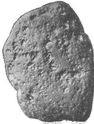
Kernstück mit Grübchen und Grübchenreihen. Slawitz bei Trebitsch. (Coll. Hanisch.)

lichen Gruben und Grübchen, gleichsam aus zahlreichen einzelnen „Schlägen“ zusammengesetzt sind, von denen jeder einen gesonderten Angriffspunkt darstellt. Die Aehnlichkeit der Aetzgruben mit den Näpfchen und Rinnen der natürlichen Oberfläche rührt wohl nur daher, dass sich in beiden Erscheinungen der molekulare Aufbau der Massen in gleicher Weise enthüllt. So wie Aetzfiguren und Schlagfiguren an ein und demselben Materiale eine Verwandtschaft zeigen, so ist das auch bei diesen Aetzgruben und bei den durch die atmosphärische Corrosion entstandenen Vertiefungen der Fall.