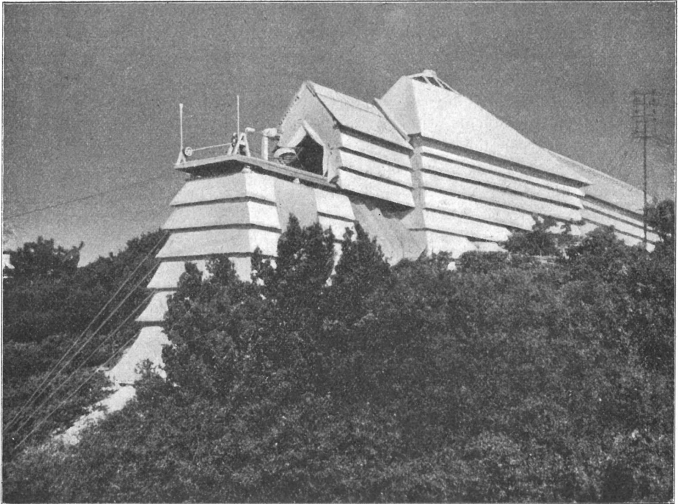
Das Südende des Hauses für das Snow-Teleskop am Sonnenobservatorium Mount Wilson. (Nach Tafel LX in The Study of Stellar Evolution. )

Die Untersuchungen der Eignung des Gipfels für das Sonnenobservatorium begannen im Jahre 1909, mit zahlreichen Beobachtungen über die Definition des Sonnenbildes mit einem 3\frac{1}{4} zölligen (8 cm) Refraktor, in Verbindung mit meteorologischen Beobachtungen.