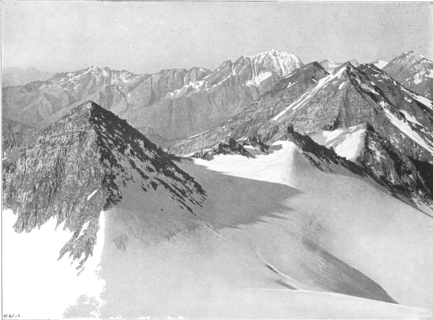
Die Aussicht vom Sonnblick gegen das Petz-Eck, über das Kleine Fleiß-Kees.