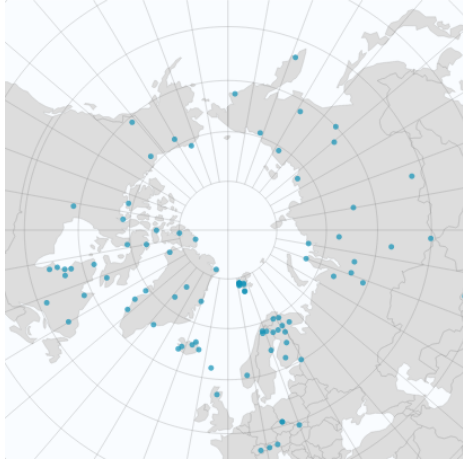
Abb.1: 83 Forschungsstationen umfasst INTERACT-II Fig.1: 83 research stations joining the INTERACT-II project

INTERACT: Das INTERNATIONALES NETZWERK für terrestrische Forschung und Monitoring in der Arktis