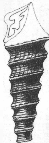
Détails du test d'après un moulage en plâtre de l'empreinte extérieure.