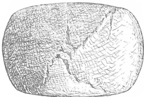
Fig. 1. Holzkugel gepreßt, mit regelmäßigen Rissen.

Versuche sind zum Überblick dieser Erscheinungsreihe vom Bruch bis zur feinbaulichen Bewegung von