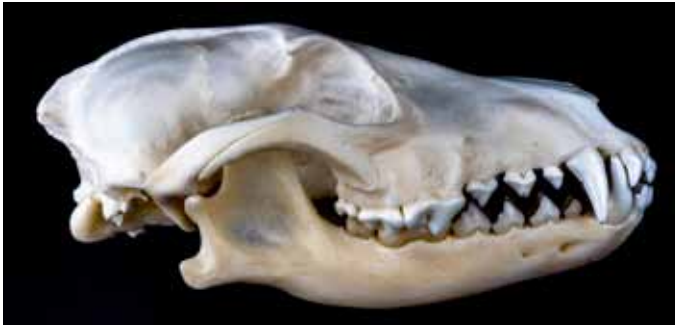
Abb.4: Kristalle mit Apatit-Struktur spielen im Tierreich als Hartschubstanz, z.B. in Knochen und Zähnen von Wirbeltieren, eine wichtige Rolle – hier exemplarisch der Schädel eines Goldschakals ( Canis aureus ).

in der belebten Natur weit verbreitet, allem voran als Hartschubstanz (vgl. Abb.4). Wie es für Wirbeltiere typisch ist, bestehen hieraus etwa auch unsere menschlichen Knochen und Zähne.