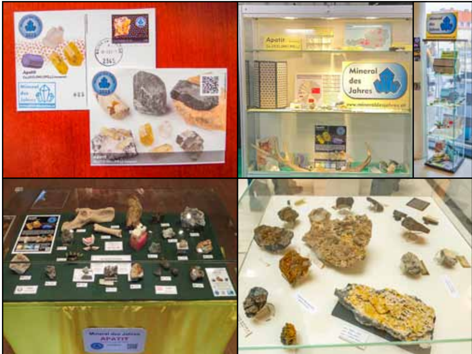
Abb.2: Exemplarische Übersicht über Aktivitäten zum Mineral des Jahres (v.l.o.n.r.u.): Ersttagsbeleg der Briefmarke, Sondervitrinen bei der Messe Mineralium in der Wiener Stadthalle, bei den Mineralientagen Brunn am Gebirge, im Geozentrum Steinstadel und im kärnten.museum.

stehenden Platzes im vorliegenden Band, beschränkt sich der vorliegende Artikel auf einen sehr kurzen Überblick über das aktuelle Mineral und zuvor an dieser Stelle die dazugehörigen Aktivitäten (vgl. Abb.2). Als vorbildhaftes Beispiel sei heuer exemplarisch das kärnten.museum herausgegriffen, das es sich mittlerweile zur guten Routine gemacht hat, alljährlich die Sammlungsbestände des jeweiligen Mineral des Jahres umfassend aufzuarbeiten und zu publizieren (BUDSKY, 2023; BUDSKY & DOJEN, 2022), sowie in einer Sondervitrine zu präsentieren und öffentliche Vorträge hierzu abzuhalten. Das große Publikumsinteresse spricht eine Empfehlung zur Nachahmung aus. Ebenfalls erfreulich war der sehr große Zuspruch zu einer Mineral des Jahres -Aktivstation bzw. -Vortrag beim öffentlichen Familiensonntag der Tagung MinWien 2023 (vgl. S.73) sowie die sehr rege Aktivität auf der Social Media-Gruppe www.facebook.com/groups/mineraldesjahres , auf welcher eifrig Informationen und fantastische Bilder von Sammlungsstücken aus aller Welt geteilt werden.