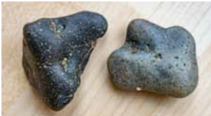
Abb.5: Phosphorit-Knollen aus den Linzer Sanden (Länge jeweils ca. 5 cm)

Aufgrund der weiten Verbreitung in belebter und unbelebter Natur, verwundert es nicht, dass vielfältigst an Apatiten geforscht wird und es zahlreiche Anwendungen gibt: Die Untersuchung dieser Minerale liefert sehr wertvolle Hinweise auf die Entstehungsgeschichte der sie beherbergenden Gesteine, der ganzen Erde und des Sonnensystems. Massenhaft abgebaut, vor allem in Form von Phosphoriten (vgl. Abb.5), sind sie wichtige Erze für die Gewinnung von Phosphor oder Fluor – welche etwa für Dünger oder zur Herstellung von Metallen und Kunststoffen notwendig sind. Seltener und gesucht sind große, klare Kristalle, die nicht nur die Herzen von Sammler*innen höher schlagen lassen, sondern auch zu Schmucksteinen verschliffen werden können. Vorteilhaft ist hier die große Farbenvielfalt: es gibt praktisch keine Farbe, die nicht schon an einem Apatit beobachtet worden ist. Nicht zuletzt ist diese Substanz auch in der Medizin zunehmend von Bedeutung, beispielsweise als künstlicher Knochenersatz oder bei Zahnimplantaten. Der starke Alltagsbezug eröffnet viele Anknüpfungspunkte zu diesem spannenden Mineral des Jahres .