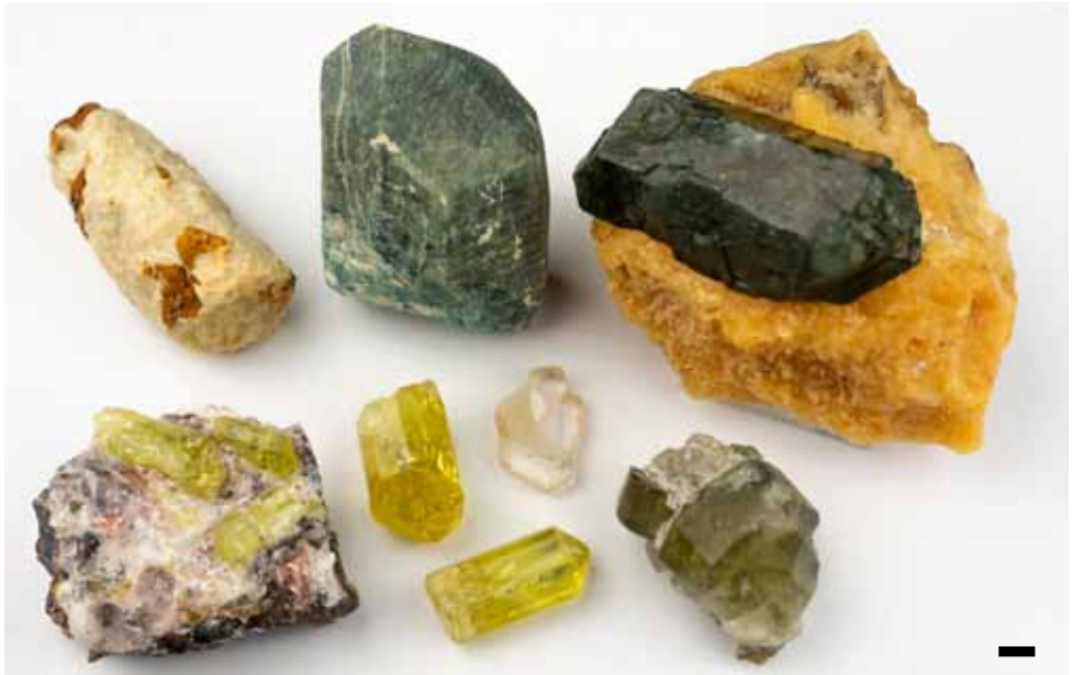
Abb.3: Veranschaulichung der farblichen Vielfalt der Mineralgruppe anhand einer Auswahl an Apatit-Kristallen unterschiedlicher Herkunft (der schwarze Balken zum Größenvergleich misst 5 mm).

\text{Ca}_5[\text{F}(\text{PO}_4)_3] , Chlorapatit \text{Ca}_5[\text{Cl}(\text{PO}_4)_3] und Hydroxylapatit \text{Ca}_5[\text{OH}(\text{PO}_4)_3] . Reine Endglieder sind in der Natur sehr selten, meist handelt es sich um komplexe Mischkristalle, die im Feld unter dem arbeitstechnisch praktischen Überbegriff „Apatit“ angesprochen werden. Die Wurzel des Namens geht auf ein griechisches Wort für täuschen zurück – was tatsächlich passend erscheint, da Apatit leicht mit anderen Mineralen verwechselt werden kann. Grund hierfür ist nicht nur eine große Fülle an auftretenden Formen und Ausbildungen, sondern auch ein Vorkommen in praktisch allen Farben (vgl. Abb.3). Während chemisch reine Apatite farblos und durchsichtig wären, wird die natürliche Farbenfülle schon durch kleine chemische Verunreinigungen oder Farbzentren (z.B. durch radioaktive Bestrahlung) hervorgerufen. Demgegenüber vergleichsweise einheitlich ist die besondere Härte, welche dazu führte, dass Apatit als Referenz-Mineral für die Härte 5 auf der zehnteiligen Ritzhärteskala nach MOHS ausgewählt wurde – die sich bis heute in der erdwissenschaftlichen Praxis großer Beliebtheit erfreut. Weitere historische Bezüge zu MOHS und anderen österreichischen Mineralogen sowie Ausführungen zur Entdeckungsgeschichte des Minerals finden sich in einer Arbeit am Ende dieses Bands (KRICKL, 2023).