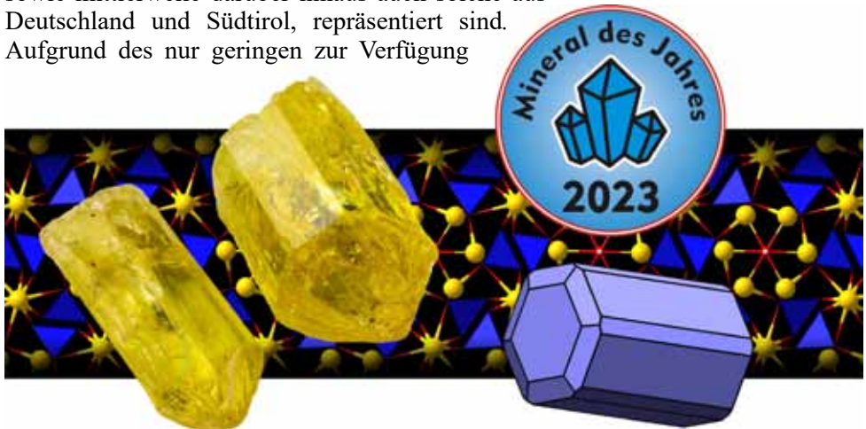
Abb.1: Ein Beispiel für das „Mineral des Jahres 2023“ Apatit, nebst der Darstellung der Kristallstruktur und eines Kristallmodells.

In Österreich haben Aktionen für Pflanzen, Tiere und Pilze des Jahres schon lange Tradition, um Aufmerksamkeit für die Vielfalt der heimischen Umwelt zu schaffen. Lange Zeit wurde hier aber praktisch ausschließlich die belebte Natur berücksichtigt – nicht jedoch die unbelebte. Um deren großen Stellenwert in unserer Umwelt, sowie ihre Rolle als wortwörtliche Grundlage von Industrie, Kultur und Wissenschaft darzustellen, wurde die Lücke mit dem Mineral des Jahres geschlossen (vgl. Abb. 1). Gewählt wird es durch eine Arbeitsgemeinschaft, in der die maßgeblichen mineralogischen Institutionen, Museen, Organisationen und Vereine (darunter auch die Österreichische Mineralogische Gesellschaft ) des Landes, sowie mittlerweile darüber hinaus auch solche aus Deutschland und Südtirol, repräsentiert sind. Aufgrund des nur geringen zur Verfügung