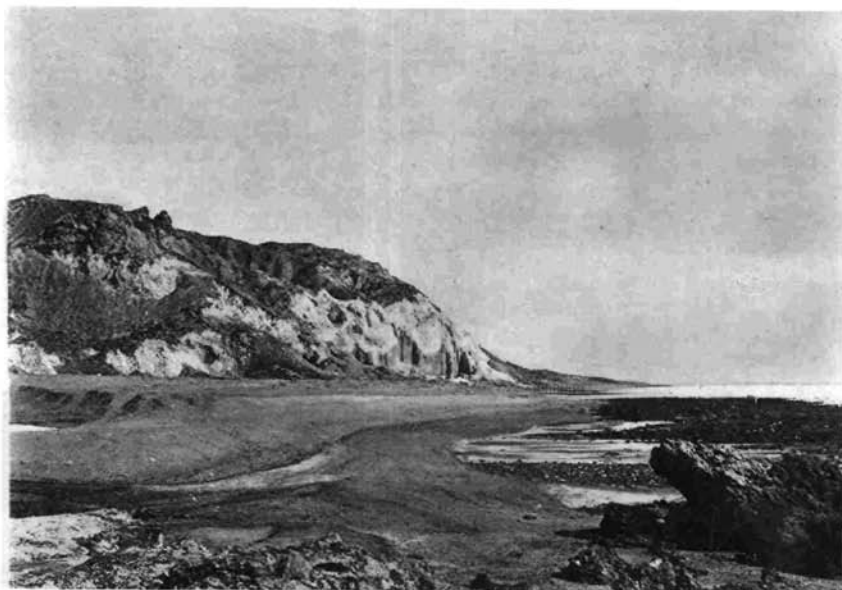
2. Salzaufbruch von Oishm, Persischer Golf. Links oben Blöcke von kambrischem Dolomit.