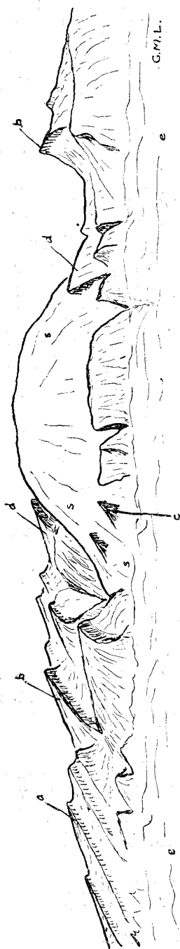
Abb. 1. Kuh-i-Namak (Dashtistan).

a = Pliozän und Miozän; b = Eozänkalk; c und d = Kreidekalk; e = Alluvium der Ebene; s = Steinsalz.