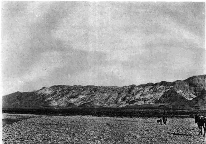
1. Kuh-i-Namak, nō. von Ginao am Persischen Golf. Weiss: Salz, dunkler: Eozän-bis Miozänkalk.