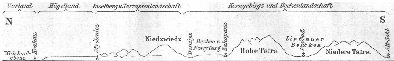
Fig. 1. Die Westkarpathen.