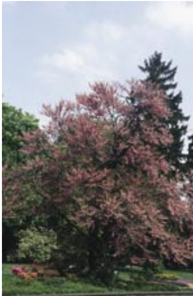
Abb. 12: Cercis siliquastrum – Gemeiner Judasbaum Freiburg, Colombi-Park, Photo 23.4.1997

Fossil ist die Gattung seit dem Eozän nachgewiesen, in Europa u. a. im Miozän von Griechenland, Ungarn und Mainz-Kastel.