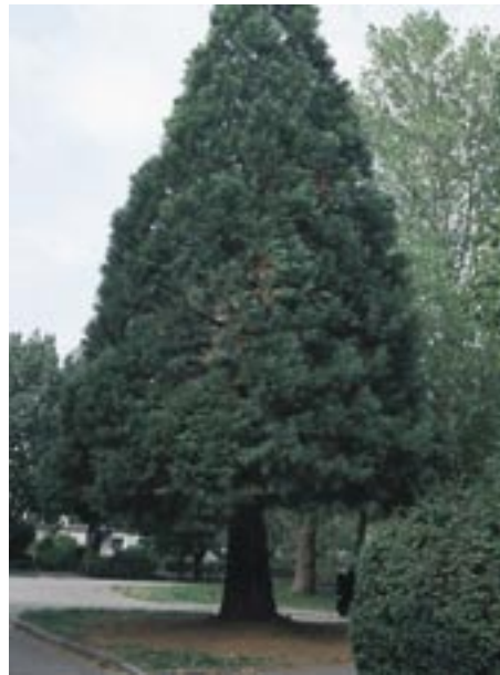
Abb. 42: Sequoiadendron giganteum – Mammutbaum (Gesamtaufnahme) Freiburg-Landwasser, Photo 20.9.2003

Rinde ist weich und von dunkelrosabrauner Farbe. Diese dicke, asbestartige Rinde macht den Baum weitgehend immun gegen Feuersbrünste. Zudem enthält auch das Holz dieser Art – ebenso wie das von Sequoia – kein Harz. Die Frucht ist ein rund-länglicher, bis 7 cm großer Zapfen. Unser Exemplar ist gegenwärtig über 22 m hoch, die ursprüngliche Spitze ist vor Jahren abgebrochen.