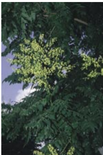
Abb. 26: Koelreuteria paniculata – Blasenesehe Neuenburg/Rhein, Photo 6.7.1993

Familie: Seifenbaumgewächse (Sapindaceae)