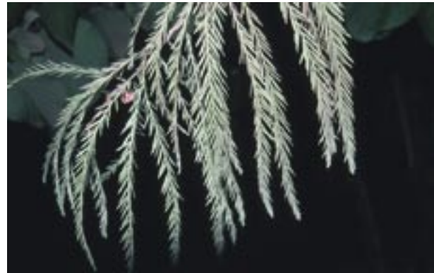
Abb. 46: Taxodium distichum – Zweizeilige Sumpfyzypresse Freiburg, Botanischer Garten, Photo 20.9.2003

– wenigstens bei den Holzresten – wahrscheinlich die häufigste Tertiär-Konifere.