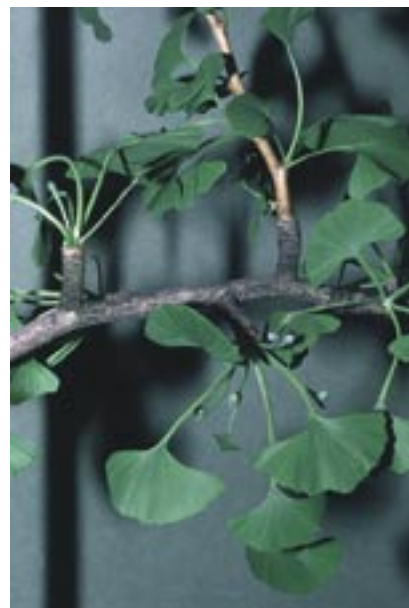
Abb. 20: Ginkgo biloba – Ginkgobaum Freiburg-Landwasser, Photo 30.4.1992

Die Pflanze ist zweihäusig, das heißt, die weiblichen und die männlichen Geschlechtsanlagen stehen auf getrennten Exemplaren. Die Frucht ist mirabellen-ähnlich, mit gelbem Fruchtfleisch und einem harten Kern, der in Japan geröstet und gegessen wird. Im Herbst stellt sich eine attraktive Gelbfärbung der Krone ein. Auffällig ist der von dem reifen Fruchtfleisch ausgehende, penetrante Buttersäuregeruch. Im Arboretum stehen zwei Exemplare dieser Art: Das weibliche ist 22,0 m hoch, das männliche 16,0 m. – Erwähnt sei, daß es sehr viele Exemplare dieser Art in Freiburg gibt, besonders viele in der Wölflinstraße.