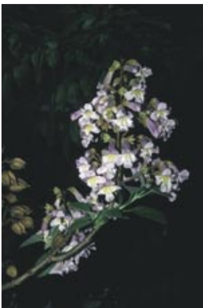
Abb. 34: Paulownia tomentosa – Blauglockenbaum Freiburg-Landwasser, Photo 2.5.2000

Dieser große Baum (20 m) ist während seiner Blüte im Mai durch die hellvioletten, bis 30 cm großen Blüten- rispen mit 5–6 cm großen, glockigen Einzelblüten sehr attraktiv. Später zeigen sich braune, rund zuge-