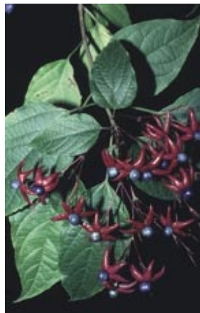
Abb. 14: Clerodendrum trichotomum – Japanischer Losbaum, fruchtend Arboretum, Photo 6.11.1987

Fossil kommt die Gattung seit dem Eozän (Nordamerika) vor, die europäischen Nachweise – u. a. aus dem polnischen Pliozän – bedürfen noch der Bestätigung.