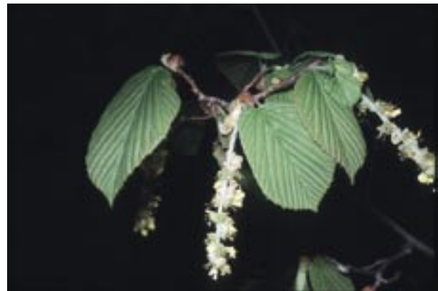
Abb. 16: Corylopsis spicata – Chinesische Scheinhasel Arboretum, Photo 25.4.1982

Die Art lebt heute in gebirgigen, feuchten Waldgebieten Mittel- und Westchinas.