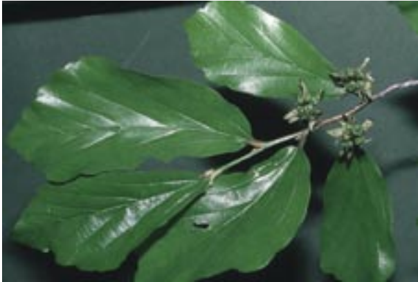
Abb. 33: Parrotia persica – Eisenholz Freiburg, Botanischer Garten, Photo 30.5.1992

von Berga (Thüringer Becken) und von Willershau- sen (bei Osterode) sowie im Altquartär bei Frankfurt (Schwanheim).