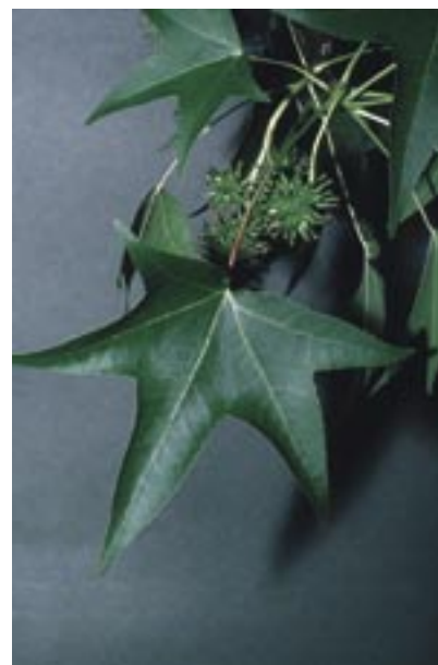
Abb. 27: Liquidambar styraciflua – Amerikanischer Amberbaum Freiburg-Landwasser, Photo 27.6.1992

Diese langsam wachsenden Bäume (13–24 m hoch) haben ahornähnliche, fünfflappige Blätter, die sich aber durch ihre Wechselständigkeit von den gegenständig stehenden Ahornblättern unterscheiden. Ein weiteres Erkennungsmerkmal sind die leistenartigen Korkwucherungen, die selbst noch bei kleineren Zweigen des Amberbaums zu beobachten sind. Die Herbst-