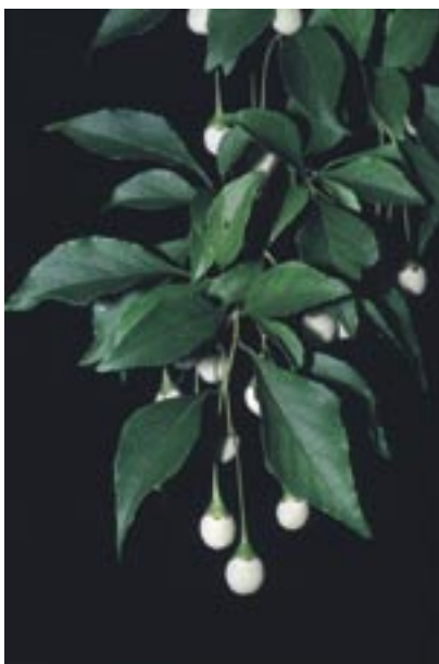
Abb. 44: Styrax japonica – Japanischer Storaxbaum Lago Maggiore, Villa Taranto, Photo 29.9.1993

Styrax japonica ist eine von etwa 120 rezenten Arten der Gattung, die in den warmen Gebieten Amerikas,