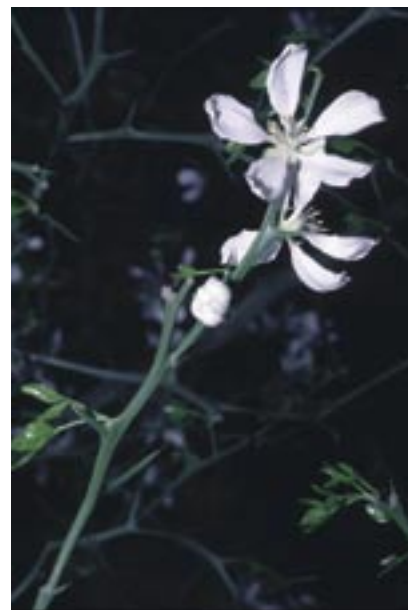
Abb. 37: Poncirus trifoliata – Bitterorange

Der verzweigte, dornenbewehrte Strauch (> 4,5 m) hat dunkelgrüne, abgeflachte Zweige mit kleinen, dreizähligen Blättern. Aus den im April erscheinenden weißen Blüten entwickeln sich bis 4 cm große, goldgelbe Zitrusfrüchte, die nicht eßbar sind, aus denen sich aber