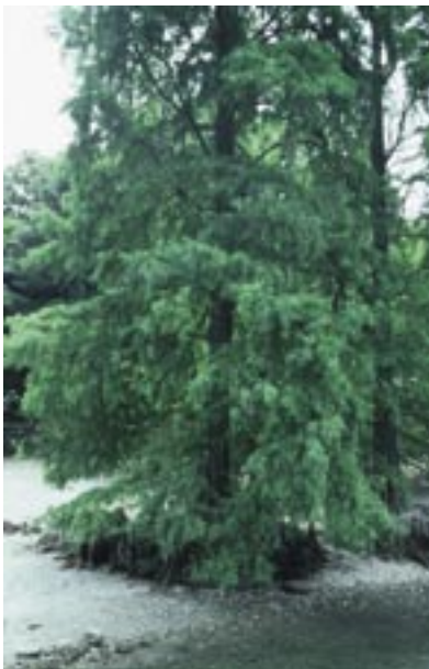
Abb. 45: Taxodium distichum – Zweizeilige Sumpfyzypresse, Luftwurzeln

Ihr natürliches Vorkommen hat diese Art (ein Waldbaum) mit sehr zerfallsresistentem Holz auf feuchten, sumpfigen Standorten und in Flußniederungen im südöstlichen Nordamerika. Die größte bis 1998 gemessene Höhe betrug 42,7 m. Es sind Exemplare bekannt, die über 1600 Jahre alt sind. Erwähnenswert ist ferner, daß die Bäume dieser Art wahrscheinlich die mit der größten Toleranz gegen Überflutung sind (bis zur Hälfte der Vegetationsperiode). Die Gattung Taxodium umfaßt neben dieser Art noch eine weitere, die im südlichen Texas, in Mexiko und Guatemala beheimatet ist und als halbimmergrün bezeichnet wird.