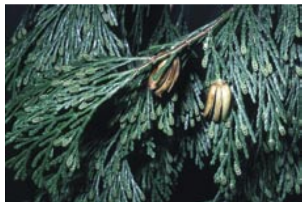
Abb. 7: Calocedrus decurrens – Rauchzypresse Freiburg, Pathologisches Institut, Photo 2.10.1983

Zwei Exemplare dieser Art wurden vor dem Pathologischen Institut, Albertstraße 19, gepflanzt und haben sich dort gut entwickelt. Das immergrüne Nadelgehölz hat kurze, schuppige Nadeln, die den Zweigen anliegen. Die kleinen Zapfen sind bis 2,5 cm groß und hängen in Büscheln an den Zweigenden. Der Wuchs der Krone ist schmal säulenförmig. Die zerriebenen Blätter riechen nach Terpentin. Das Holz hat einen würzigen Duft, weshalb die Rauchzypresse fälschlich auch als „Zeder“ bezeichnet wird. Die Art kommt in den Gebirgswäldern des westlichen Nordamerikas vor (Kalifornien bis Oregon und W-Nevada, Niederkalifornien).