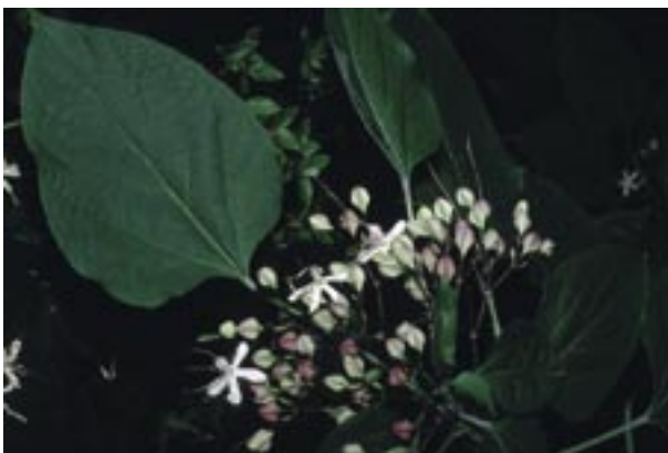
Abb. 13: Clerodendrum trichotomum – Japanischer Losbaum, blühend Lago Maggiore, Isola di Brisago, Photo 30.8.1992

Familie: Eisenkrautgewächse (Verbenaceae)