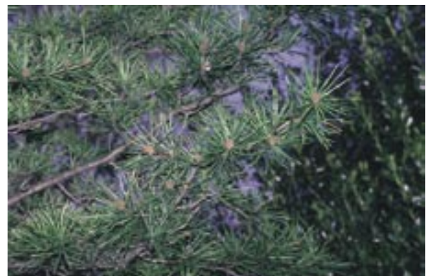
Abb. 40: Sciadopitys verticillata – Schirmtanne Freiburg, Botanischer Garten, Photo 20.3.1993