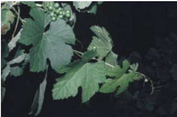
Abb. 47: Vitis vinifera ssp. sylvestris – Wildrebe Freiburg, Botanischer Garten, Photo 5.9.1992