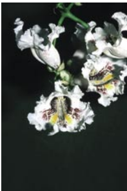
Abb. 9: Catalpa bignonioides – Einzelblüte Freiburg, Pathologisches Institut, Photo 26.6.1992

Dieser Baum mit glatter buchenartiger Rinde steht im unmittelbar benachbarten Garten des Instituts für Rechtsmedizin, Albertstraße 9. Er wächst häufig vielstämmig über einem kurzen Hauptstamm und ist kenntlich an den ovalen, sägerandigen Blättern mit