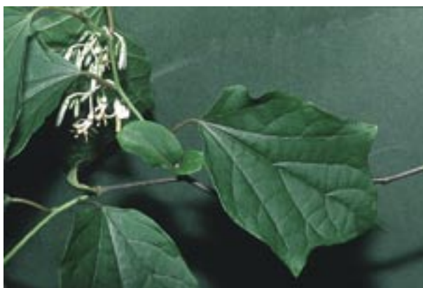
Abb. 6: Alangium platanifolium – Platanenblättrige Alangie Freiburg, Botanischer Garten, Photo 22.7.1993

Familie: Alangiengewächse (Alangiaceae), früher Hartriegelgewächse (Cornaceae)