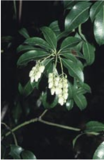
Abb. 35: Pieris japonica – Japanischer Weißglockenstrauch

Miozän, im Pliozän von Polen und des Elsaß sowie im Altpleistozän, gibt es ebenfalls.