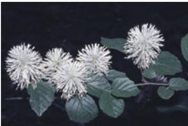
Abb. 19: Fothergilla monticola – Berg-Federbusch- strauch

Die im Mai erscheinenden weißen Blütenstände an dem kleinen Strauch bilden einen reizvollen Gegensatz zu den spärlich behaarten, dunkelgrünen, spitz-eiförmigen Blättern. Diese Art kommt natürlich in der sommerwarmen gemäßigten Zone des östlichen Nordamerikas vor, ebenso wie F. major (SIMS) LODD., zu der sie von manchen Autoren nur als Synonym angesehen wird.