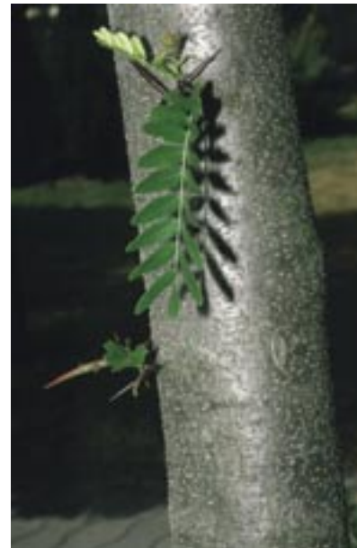
Abb. 22: Gleditsia triacanthos – Amerikanische Gleditschie, Stamm mit Dornen

Fossile Vorkommen der Gattung gibt es seit dem Eozän, u. a. im Miozän des Alpenvorlands und der Schwäbischen Alb (Illertissen, Randecker Maar, Steinhheimer Becken, Öhningen, Hohenkrähen/Hegau), bei Mainz-Kastel, in Niederbayern, Nordböhmen, Ungarn und im Wiener Becken.