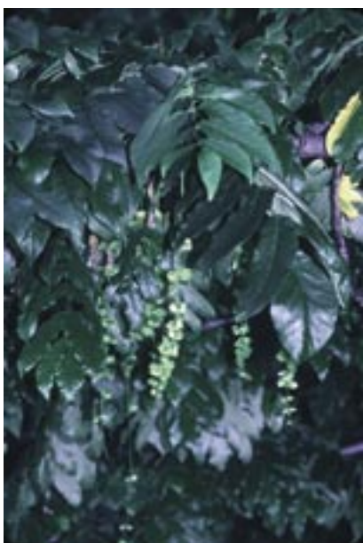
Abb. 38: Pterocarya fraxinifolia – Kaukasische Flügelnuß Arboretum, Photo August 1979

Die Gattung ist fossil seit dem Paleozän nachgewiesen. In miozänen Schichten und seltener im Pliozän werden