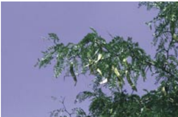
Abb. 21: Gleditsia triacanthos – Amerikanische Gleditschie, Alleebaum

Die anderen 13 Arten der Gattung sind in Asien (von Transkaukasien bis Japan und Neuguinea), Nord- und Südamerika heimisch.