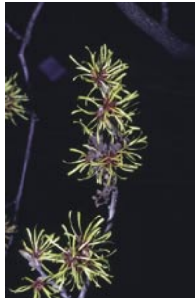
Abb. 25: Hamamelis mollis – Chinesische Zaubernuß Freiburg, Botanischer Garten, Photo 5.1.1994

Die Chinesische Zaubernuß fällt durch ihre mehrfarbigen, wohlriechenden Blüten auf: Die Kronblätter sind goldgelb und haben eine rötliche Basis. Die Staubblätter und der Griffel sind weinrot, wie auch die Innenseite der geraden oder wenig zurückgebogenen Kelchblätter, deren Außenseiten graubraun sind. Die Blätter dieses Großstrauchs sind beidseitig weichhaarig.