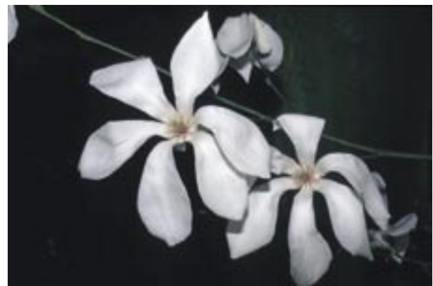
Abb. 29: Magnolia kobus – Kobushi-Magnolie Freiburg, Botanischer Garten, Photo 21.3.1991

Es handelt sich um eine reinweiß blühende Magnolie mit vergleichsweise schmalen Kronblättern, die in Japan heimisch ist und sommerwarmes humides Klima liebt. Der Stamm (>15 m) besitzt aufstrebende Äste.