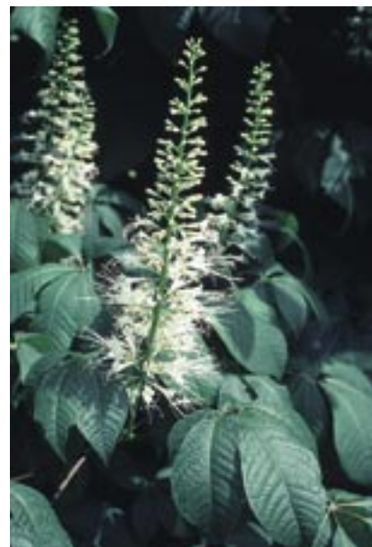
Abb. 4: Aesculus parviflora – Schwärmer-Roßkastanie Arboretum, Photo 4.7.1981

Die Gattung ist fossil seit dem Paleozän (z. B. auf Spitzbergen) bekannt. Gefunden wurden fossile Reste u. a. im Miozän (z. B. bei Böttingen auf der Schwäbischen Alb, in der Niederlausitz, in Polen und im Kaukasus) und Pliozän sowie im Altquartär von Bayerisch-Schwaben, im Pliozän ist sie außerdem auch bei Frankfurt, im Elsaß, am Niederrhein, in Schleswig-Holstein, in Willershausen bei Osterode am Harz (Niedersachsen) sowie in den Niederlanden nachgewiesen.