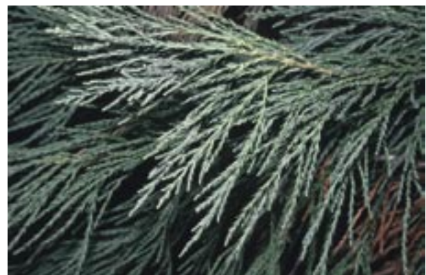
Abb. 43: Sequoiadendron giganteum – Mammutbaum (Ausschnitt) Freiburg-Landwasser, Photo 20.9.2003

Das natürliche Vorkommen dieses Nadelgehölzes ist ein isoliertes Verbreitungsgebiet an den Westhängen der kalifornischen Sierra Nevada in einer Höhe zwi-