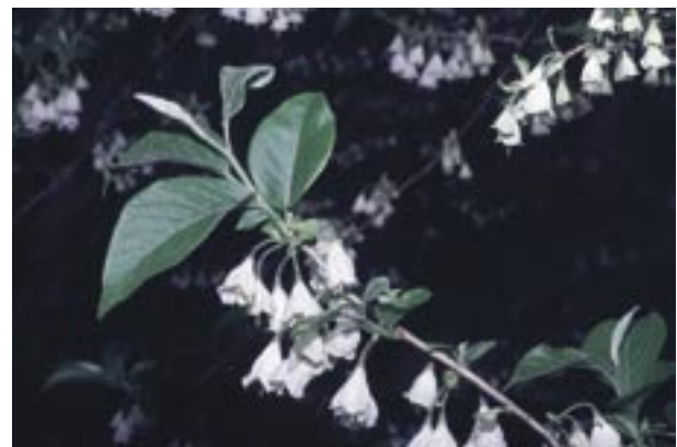
Abb. 23: Halesia carolina – Carolina-Schneeglöckchenbaum

Familie: Storaxbaumgewächse (Styracaceae)