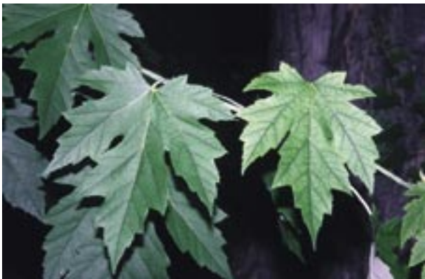
Abb. 3: Acer saccharinum – Silberahorn Arboretum, Photo 24.6.2003

Ahornreste sind fossil seit dem Anfang des Tertiärs sicher belegt, wahrscheinlich existierte die Gattung schon in der Oberkreide. Ihre typischen lappigen Blätter und Flügelfrüchte wurden z. B. im Eozän des Geiseltals, im Oligozän des Rheinlands (Rott) und der Lausitz, im Miozän des Vogelsbergs und des Randecker Maars, von Engelswies bei Sigmaringen, Würtingen, Öhningen und des Steinheimer Beckens, der Schweiz, des Hegaus, der Lausitz, des Steirischen und des Wiener Beckens gefunden. Im Pliozän und im Quartär sind sie allgemein verbreitet.