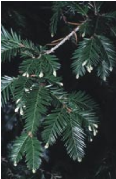
Abb. 41: Sequoia sempervirens – Küstenmammutbaum Freiburg, Botanischer Garten, Photo 5.1.1994

Die Gattung kommt fossil unter anderem in den tertiärzeitlichen Braunkohlen Mitteleuropas, im Pliozän des Niederrheins, von Frankfurt, Willershausen, Thüringen und des Elsaß vor.