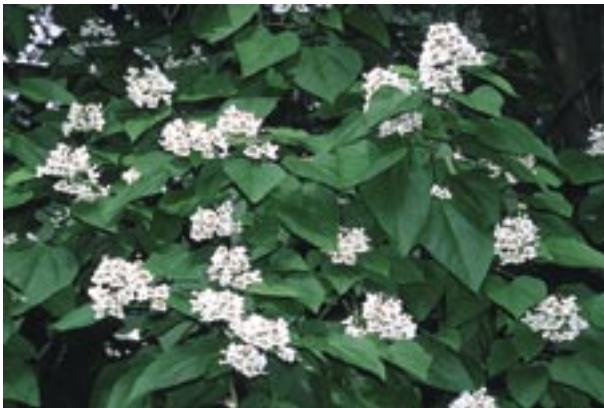
Abb. 8: Catalpa bignonioides – Gewöhnlicher Trompetenbaum

Familie: Klettertrompetengewächse (Bignoniaceae)