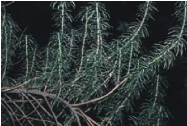
Abb. 11: Cephalotaxus harringtonia ‚Fastigiata‘ – Harringtons Kopfeibe

Fossil ist die Gattung seit dem Paleozän belegt, in Mitteleuropa wurde sie u. a. im Miozän des Rheinlands