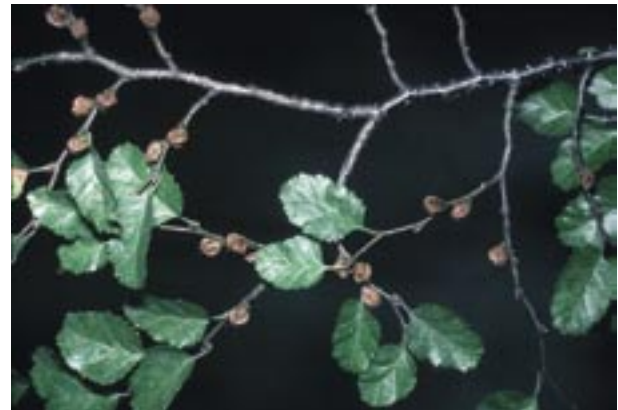
Abb. 32: Nothofagus antarctica – Südbuche Arboretum, Photo 2.10.1983

Fossil ist die Gattung seit der Oberkreide bekannt, auch die fossilen Vorkommen befinden sich alle auf der Südhalbkugel, mit vielen Arten z. B. in Neuseeland.