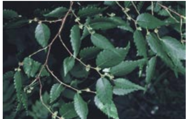
Abb. 48: Zelkova serrata – Japanische Zelkove Freiburg, Botanischer Garten, Photo 4.5.1993

Fossil kommt die Gattung seit dem Paleozän vor, mit fraglichen Resten ist sie bereits in der Oberkreide vertreten. In Mitteleuropa ist sie u. a. aus dem Oligozän von Rott, dem Miozän (Hegau, Öhningen, Randecker Maar, Würtlingen, Steinheimer Becken, Alpenvorland, Oberpfalz, Niederbayern, Sprendlingen in Rheinhessen) und dem Pliozän des Elsaß, der Niederlande, von Thüringen und Willershausen bekannt.