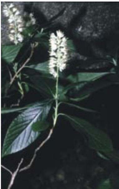
Abb. 15: Clethra alnifolia – Erlenblättrige Zimterle Arboretum, Photo 14.8.1982