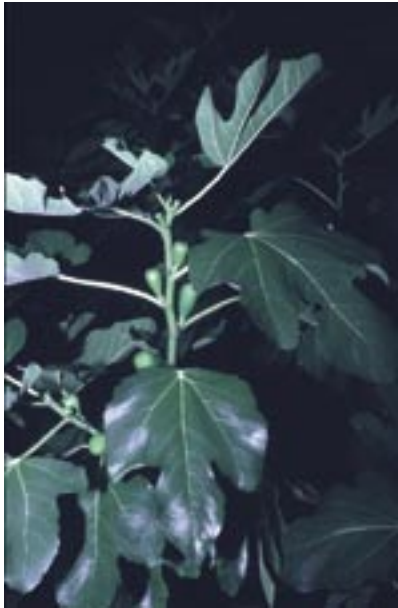
Abb. 18: Ficus carica – Feige Lago Maggiore, Villa Taranto, Photo 18.7.1996