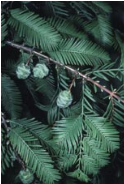
Abb. 31: Metasequoia glyptostroboides – Chinesisches Rotholz Freiburg-Landwasser, Photo 2.10.1983

Fossil ist diese Gattung seit der Unterkreide bekannt, unter anderem aus dem Miozän von Grönland. Zusammen mit Liquidambar , Sassafras , Vitis und anderen weisen diese Funde auf ein gemäßigt-warmes bis subtropisches Klima im Miozän Grönlands hin. Zu dieser Zeit hätte Grönland demnach eine südlichere geographische Lage gehabt und wäre in der Folgezeit bis zur Gegenwart um etwa 15° nach Norden in den arktischen Klimabereich gedriftet.