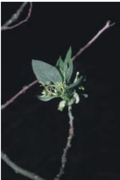
Abb. 39: Sassafras albidum – Sassafras Arboretum, Photo 29.4.1992, (siehe auch Titelbild)

Die Gattung Sassafras kommt fossil bereits in der Unterkreide von Nordamerika vor und später im Miozän der Lausitz, der Oberpfalz, Böhmens, Hessens und des französischen Zentralmassivs sowie im elsässischen Pliozän. Nahe verwandte Lorbeergewächse wurden im Eozän des Geiseltals bei Halle und von Messel bei Darmstadt gefunden.