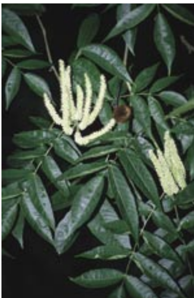
Abb. 36: Platycarya strobilacea – Zapfennuß