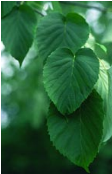
Abb. 17: Davidia involucrata – Taschentuchbaum Freiburg-Landwasser, Photo 7.9.2003