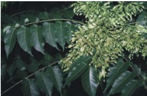
Abb. 5: Ailanthus altissima – Drüsiger Götterbaum Freiburg, Habsburger Straße, Photo 22.7.1993

Die Gattung ist fossil seit dem Paleozän bekannt. Sie kommt u. a. im Oligozän von Badenweiler, des Elsaß und des Rheinlands (Rott) vor sowie im Miozän der Schwäbischen Alb (u. a. Randecker Maar, Steinheimer Becken), des Alpenvorlands, des Wiener Beckens, Polens, Ungarn und Rumäniens.