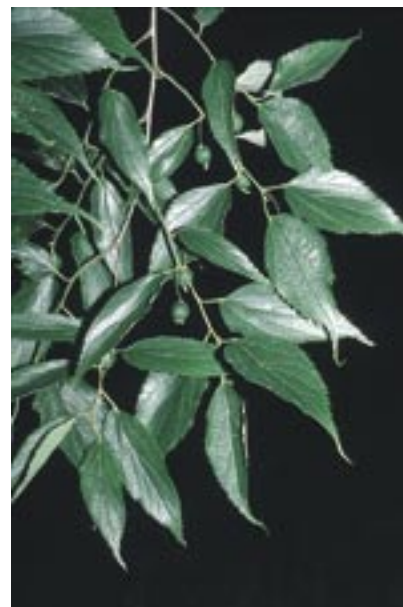
Abb. 10: Celtis australis – Südlicher Zürgelbaum Arboretum, Photo 26.6.1992