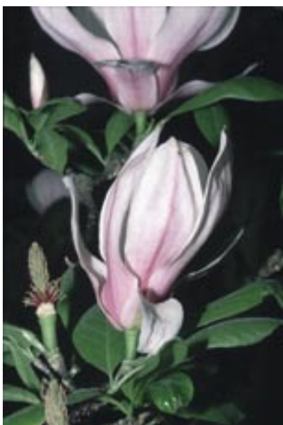
Abb. 30: Magnolia x soulangiana – Gartenmagnolie Freiburg-Landwasser, Photo 29.4.1992

In der geologischen Vergangenheit haben die Magnoliengewächse eine wichtige Rolle gespielt. Ihre zapfenartige Blütenachse mit den dichtstehenden Blütenblättern erinnert an die Zapfen der Nadelgehölze