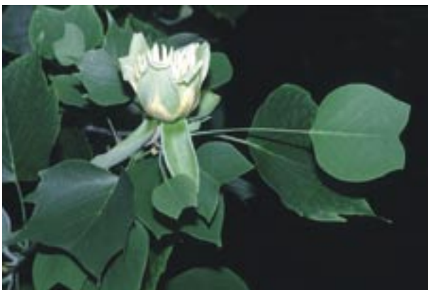
Abb. 28: Liriodendron tulipifera – Tulpenbaum Freiburg-Landwasser, Photo 27.5.1992

Die Art ist heute in den sommerwarmen, humiden Waldgebieten des östlichen Nordamerikas heimisch. Die zweite heutige, nicht so groß werdende Art lebt in Mittel- und Ostasien.