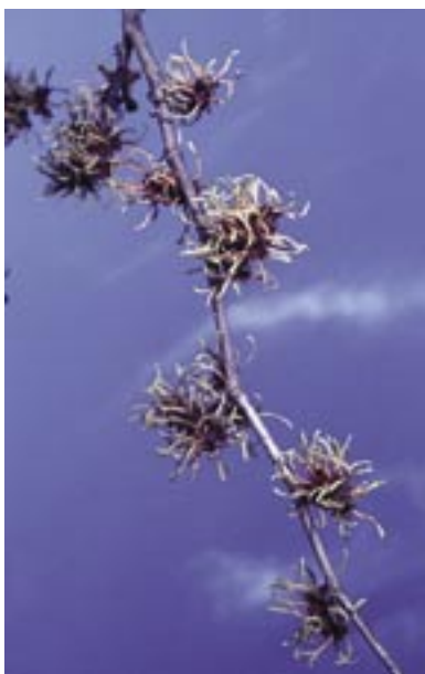
Abb. 24: Hamamelis japonica – Japanische Zaubernuß Freiburg-Landwasser, Photo 16.2.1980

Diese Art kommt heute natürlich in ganz Japan vor. Teilweise werden die Rinde und die Blätter zu medizinischen Zwecken genutzt (u. a. in Salben und Tinkturen