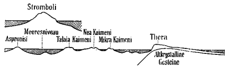
Profil durch den Ringwall von Thera. Nach der österr. Karte.

Aus dem gewaltigen, 30 km im Umkreis messenden, jetzt erloschenen und meererfüllten Krater von Thera erheben sich in der Mitte die Kaimeniinseln, der einzige noch tätige Vulkan des östlichen Mittelmeers. Die Lava floss hier aus den Kratern dieser kleinen Inseln in das Meer und der ganze Vulkankegel der Kaimeni ragt nur zu einem Drittel aus dem Meer empor. Sowohl der älteste Krater, der Ringwall von Thera, wie der neue innere Krater, die Kaimeniinseln, haben aber im ganzen eine für Vulkane sehr flache Böschung, wie auf der beiliegenden Skizze die Vergleichung vom Stromboli und Thera ergibt. Das Meer ist nicht tief. Daher sollte man glauben, dass die Laven im Krater der Kaimeniinseln das Meer nicht unerheblich erwärmen müssten, falls sie in geringem Abstand von der Erdoberfläche noch flüssig wären.