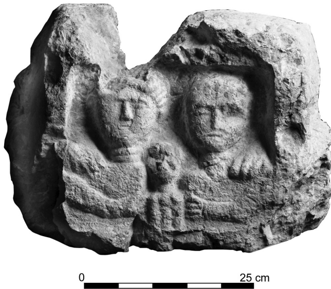
Abb. 2: SALZBURG G10

Kalksteinen lokaler oder regionaler Provenienz gefertigt worden und die Reliefs zeigen Personen mit „überbetonten Köpfen und schwächtigen Ärmchen“ 29 , wobei die Arme rechteckig abgebogen und vor dem Oberkörper zusammgeführt sind. Die besser erhaltenen Darstellungen auf MONDSEE G06 (kleines Bildfeld) und ST. GEORGEN G01 offenbaren, dass auch die Details wie Haare, Nasen, Mundpartien, Fibeln, Hände und Attribute eher dilettantisch ausgeführt worden und auf wenige Konturen reduziert sind. Auf Grund dieser Beobachtungen und der Tatsache, dass die Objekte alle in Orten gefunden worden sind, die maximal 45 km voneinander entfernt liegen, bestehen meiner Meinung nach keine Zweifel, dass wir drei Werke vor uns zu haben, die ein und demselben Bildhauer zuzuschreiben sind. Mit Ausnahme von Lauriacum – Enns, wo wir jüngsten Untersuchungen zufolge vermutlich fünf Werkstätten identifizieren können 30 , ist ein derartig eindeutiger Nachweis in Oberösterreich bislang noch nicht gelungen. Der Stein aus St. Georgen wirkt durch die plumpen Kopfformen, die fehlende Halspartie des Mannes sowie die überzeichneten Augenpartien besonders „roh“ 31 und ist vielleicht als das früheste, uns bekannte Werk des Bildhauers anzusprechen.