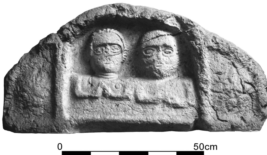
Abb. 1: ST. GEORGEN G01

Verwahrt: St. Georgen/Attergau, Pfarrmuseum