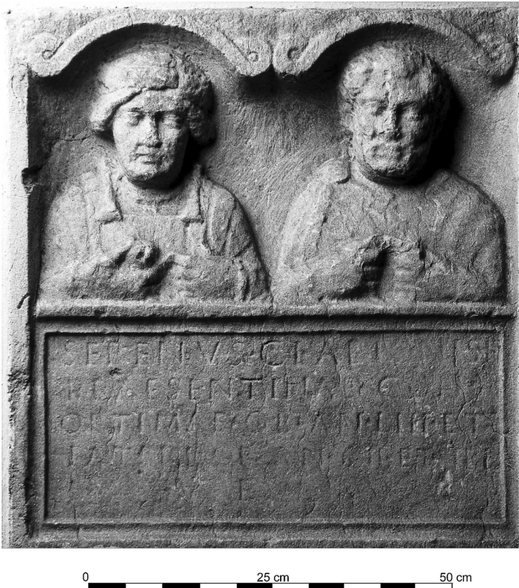
Abb. 5: MONDSEE G01

maler hergestellt worden sind 40 , ist davon auszugehen, dass die Objekte im 2. oder 3. Jh. entstanden sind 41 . Eine frühere Datierung ist deshalb auszuschließen, da diese Arbeiten nicht ohne konkrete Vorbilder vorstellbar sind. L. Eckhart hat im Zusammenhang mit ST. GEORGEN G01 bereits auf den Grabstein des Serenus und der Praesentina aus Mondsee verwiesen 42 , der in der Vorhalle der Klosterkirche von Mondsee eingemauert ist: MONDSEE G01 (Abb. 5) 43 . Und tatsächlich erinnern die Armhaltungen des Ehepaares