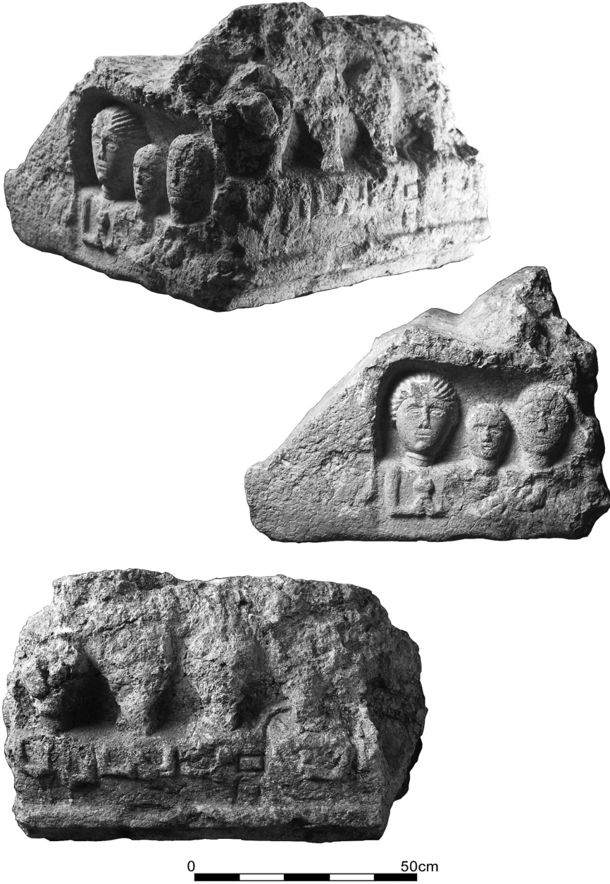
Tafel 2: MONDSEE G06