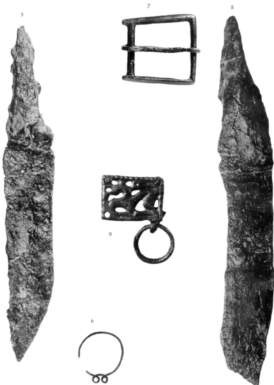
Gusen-Berglitzl: Gräber des 9./10. Jhs.: Abb. 5: Eisenmesser, Abb. 6: Bronzering (Grab Nr. 103), Abb. 7: Bronzeschnalle, Abb. 8: Eisenmesser (Grab Nr. 129); Abb. 9: Gürtelbeschlagn (Streufund). M = 1 : 1. (zu S. 80 f.)