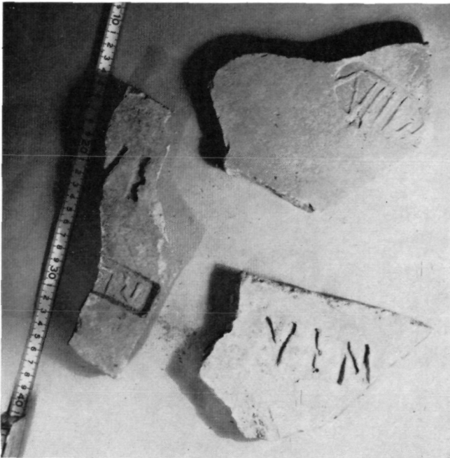
Abb. 2: Beispiele der gefundenen Ziegelstempel (verkleinert)