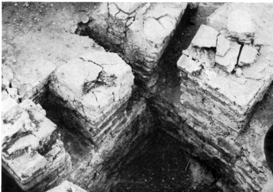
Abb. 3: Rauchabzüge des Ziegelofens von Erla