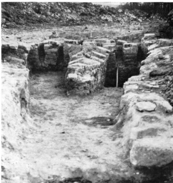
Abb. 4: Einblick von Westen in Richtung der Rauchabzüge