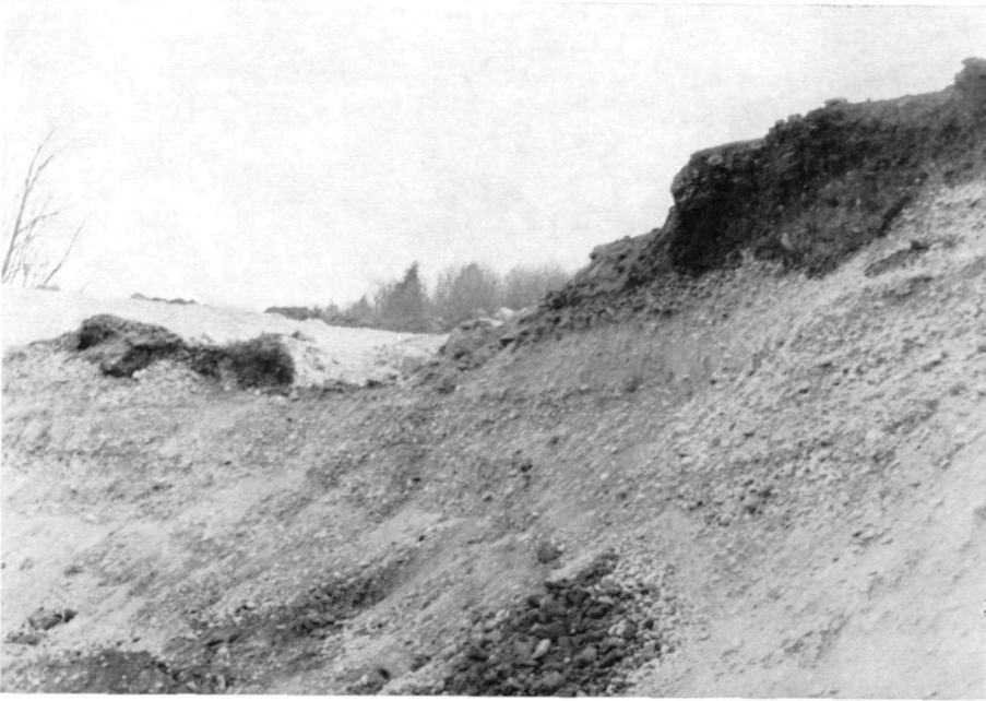
Abb. 1: Situation des römischen Ziegelofens bei Erla (zu S. 69)