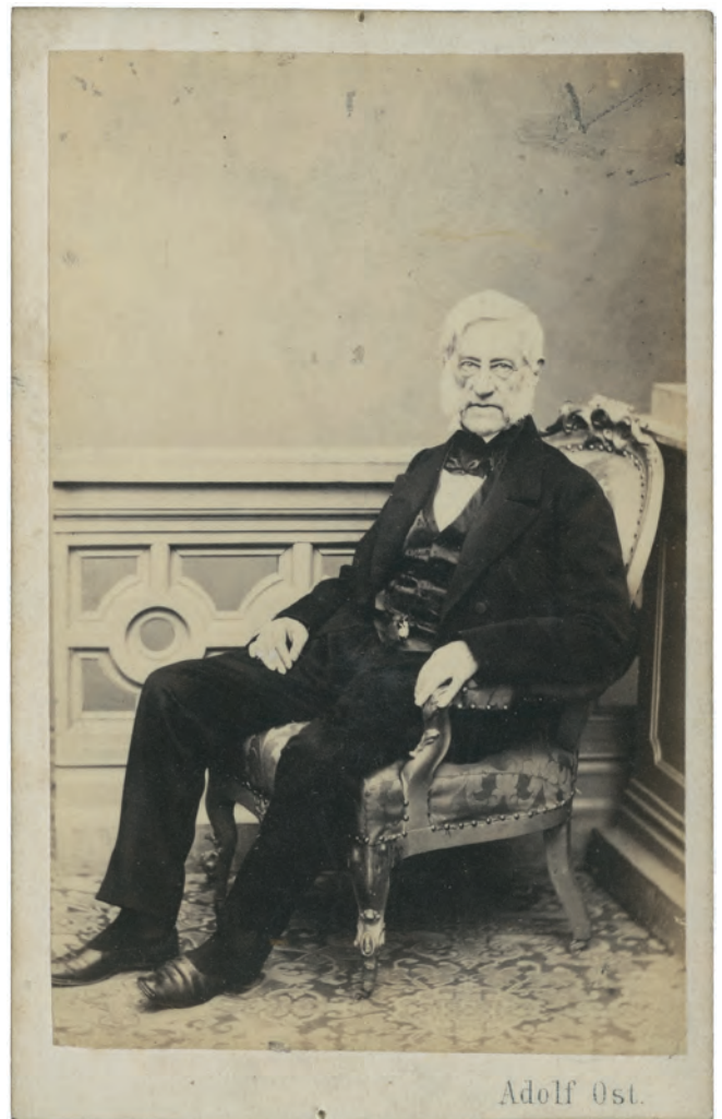
Abb. 4. Wilhelm von Haidinger. Fotograf: Adolf Ost, Wien (Alexander Turnbull Library, PA2-1292).

Der Name Haidinger findet sich dank der Initiative von Haast auch in der Bezeichnung von Mount Haidinger 3.068 m (Abb. 5) in den südlichen Alpen Neuseelands wie-