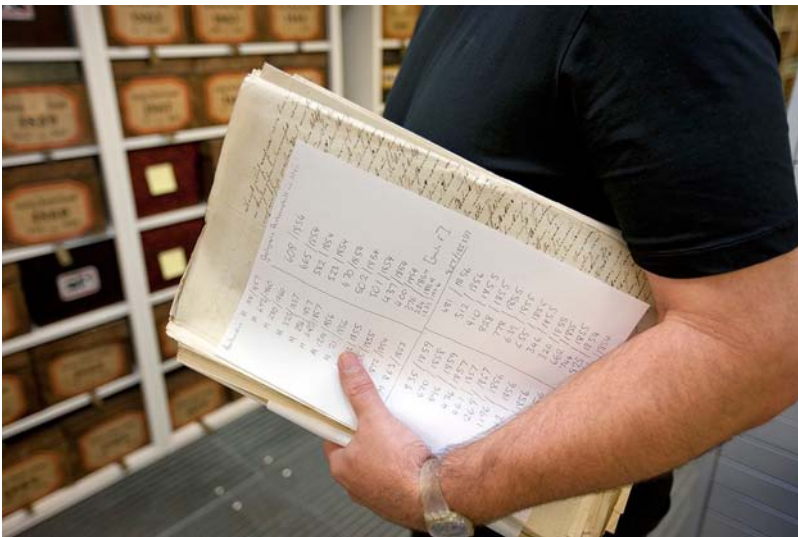
Abb. 4. Im Amtsarchiv werden historische Schriftstücke seit der Gründung der k.k. Geologischen Reichsanstalt aufbewahrt.