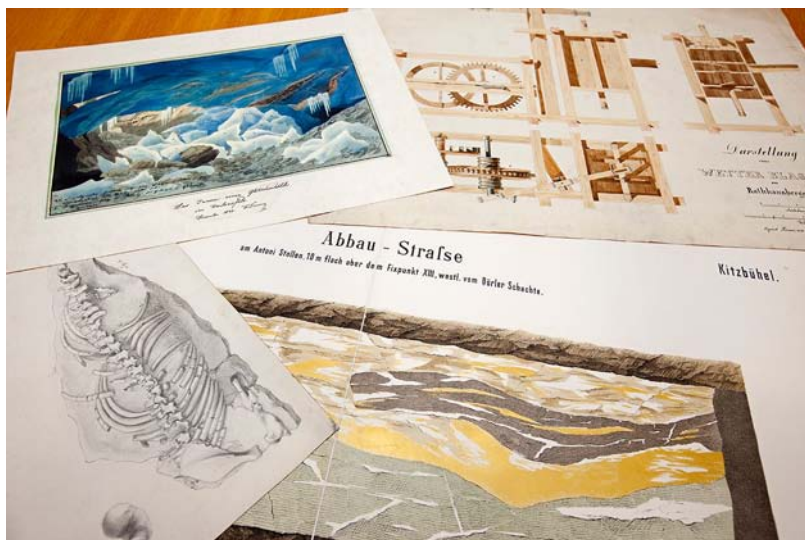
Abb. 2. Zimelien aus der graphischen Sammlung der GBA, die von Tillfried Cernajsek ins Leben gerufen wurde.