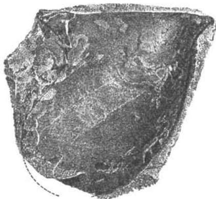
Gervilleia cf. Bouéi v. Hauer .