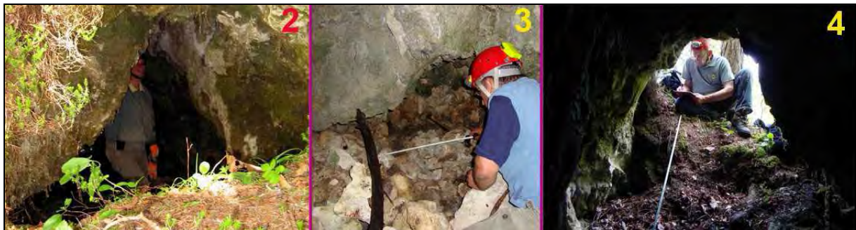
Abb. 2: Einstieg, Abb. 3: Grabung Abb. 4: Einstieg nach Außen

"Suchet und ihr werdet finden". Leichter gesagt als getan. Als Otto JAMELNIK sen. mir den Besuch bei Zdravko HADERLAP vlg.Vinkl in Leppen wegen der Suche nach der Lepa jama vorschlug, war ich sehr begeistert.