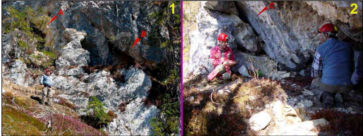
Abb. 1: A = Einstieg in die Turmkluft, B = Halbhöhle. Abb. 2: Halbhöhle, A = Verbindung zur Turmkluft.