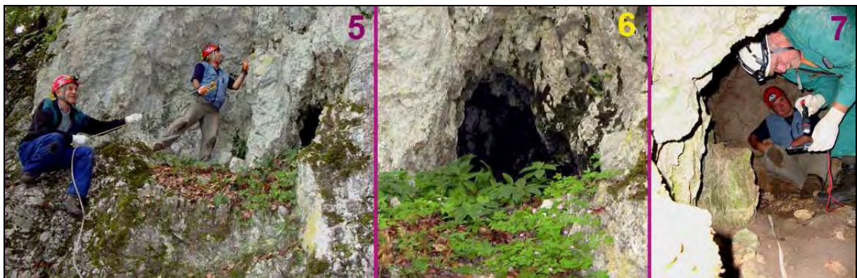
Abb. 5: Balkonartige Felsstufe Abb. 6: Einstieg Abb.7: Sicht zum Innenraum