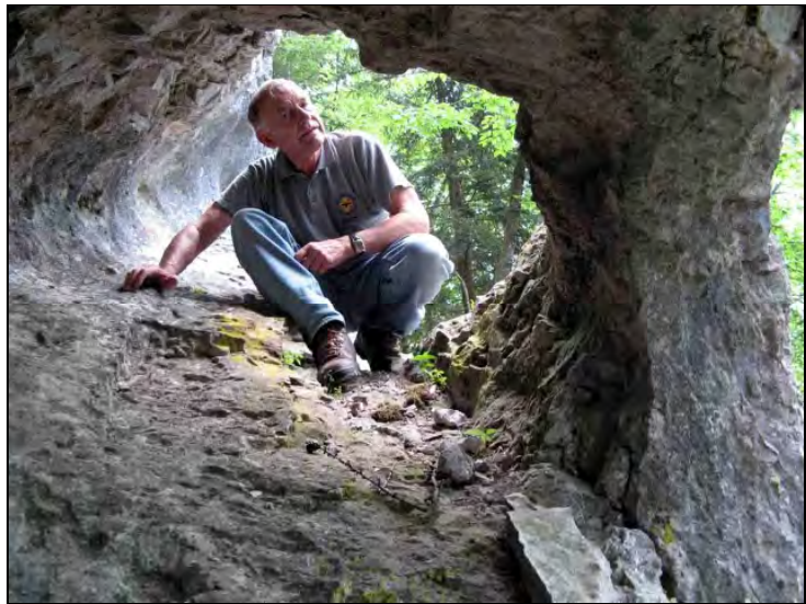
Abb. 7: kleine Durchgangshöhle.

Eine dritte Höhle, die kleine Durchgangshöhle (Abb. 7), welche sich in unmittelbarer Nähe von den oben genannten Objekten befindet, haben wir nicht vermessen, da uns diese zu unscheinbar erschien. In allen drei Höhlen ist jede Menge Losung von Gemen vorhanden, ein Zeichen dafür, daß diese Höhlen häufig von Gemen aufgesucht und als Unterschlupf benutzt werden.