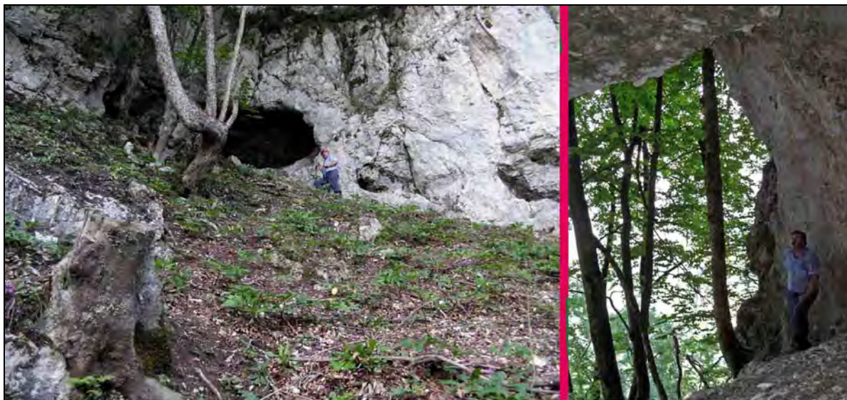
Abb. 2: Ostyra-Halbhöhle mit der Steinbuche (Ostrya) im Vordergrund. Rechts = Ausblick nach Norden.

Immer, wenn Otto JAMELNIK mich besuchte, schaute er des öfteren in den Nordhang des Sittersdorfer - Berges hinauf und meinte: „Da oben, oberhalb vom Miklauzhof, sieht man von