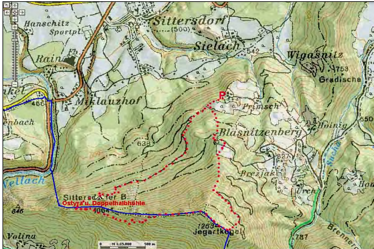
Abb. 1: Lage und Zugang zur Ostyra- und Doppel-Halbhöhle. P = Parkplatz, rot punktierte Linie = Wanderroute.

Verfasser: Georg PLANTEU und Otto JAMELNIK