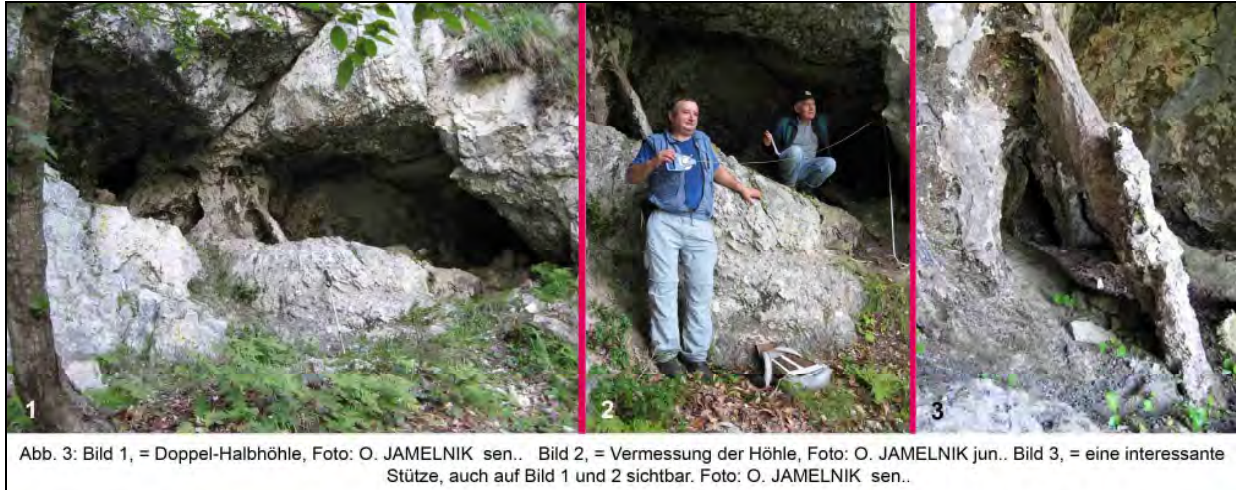
Abb. 3: Bild 1, = Doppel-Halbhöhle, Foto: O. JAMELNIK sen.. Bild 2, = Vermessung der Höhle, Foto: O. JAMELNIK jun.. Bild 3, = eine interessante Stütze, auch auf Bild 1 und 2 sichtbar. Foto: O. JAMELNIK sen..

Wir marschierten dann ca. 2 km ziemlich eben bis zur Marienschürze, einer gewaltigen Gesteinsriesen, welche sich bis zum Grat des Sittersdorferberges hinaufzieht und wo auch ein