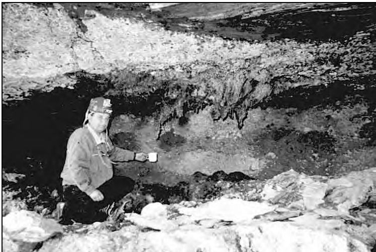
Abb. 3: Mit Moos bewachsene Tuffstalaktiten, welche einem Kuheuter ähnlich sehen und von denen Wasser rinnt

Der frühere Besitzer des Schlosses Möchling, Herr Artilleriehauptmann INZINGER (*) schreibt, dass am Plafondgemälde (1500) des Refektoriums die Burg Prosinza an den Zinnen