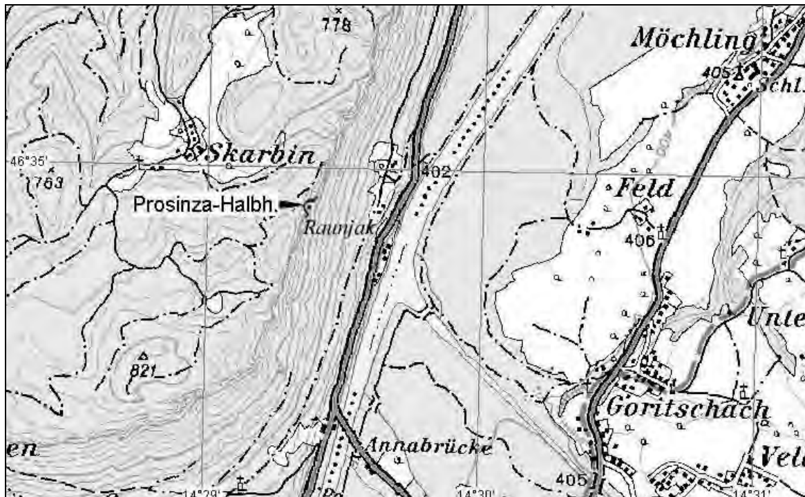
Abb. 1: Lage der Prosinza-Halbhöhle