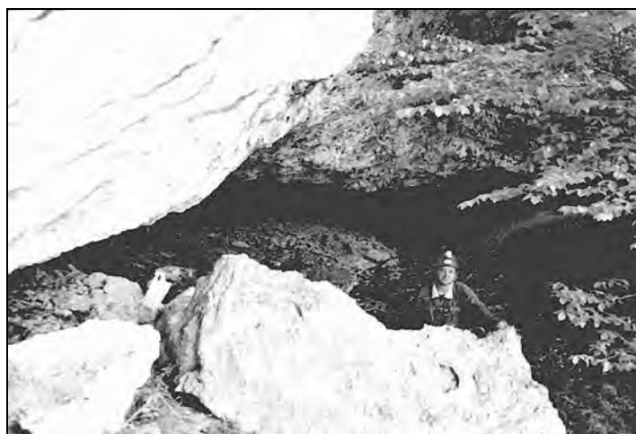
Abb. 4: Prosinza-Halbhöhle, im Vordergrund die Kuh mit den vielen Namen, Foto Otto: Jamelnik sen.

Es ist alles mit dunkelgrünen Moos bedeckt, an der Decke sowie am Boden haben sich Tropfsteine aus Tuff gebildet. In unmittelbarer Nähe davon liegen (noch unter der Traufenlinie) drei Felsblöcke, welche der Sage nach die versteinerte Kuh mit der Magd Lupa darstellen sollten. (Siehe anschließend die Sage „Hildegard von Stein“). Sie könnten vormals eine andere Position gehabt haben, wovon man sich den größeren ohne weiteres als eine liegende Kuh vorstellen könnte (Abb. 4). Dort sind viele Namen eingemeißelt, wovon einige recht gut leserlich sind. Da steht z.B. R. KUTTERER und Tino MACHER, ferner