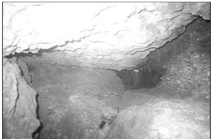
Abb. 3: Die engste Stelle, gleich nach dem Einstieg mit Lukas PLASONIG im Bild.

Gegen Süden geht ein schluchtartiger 80 cm breiter, halbrunder Einschnitt ohne Überdachung nach oben. Anschließend sind noch ein paar m 2 überdacht wo man darunter aber nur mehr hocken kann, die Höhe ist an der Traufe 2,00 m dann geht sie auf 0 m. Beträgt bei MP 3 die Breite noch 1,50 m und die Höhe 1,00 m, schrumpft sie bei MP 4 auf 70 x 30 cm zusammen (Abb. 3) Bei MP 5 erweitert sich die Kluft wieder auf 80 cm Breite und 60 cm Höhe. Erst bei MP 6 wird es geräumiger, bei MP 7 beträgt die absolute Höhe 2,20 m und die Breite 1,80 m.