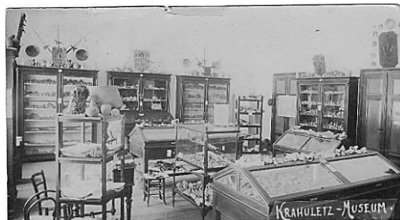
Krauhuletz Arbeitszimmer (alte Ansichtskarte)

Aufgrund der heute noch nicht vorhersehbaren Pandemie-Beschränkungen bitte unbedingt die WEB-Seite beachten oder per mail rechtzeitig nachfragen. Möglicherweise muss ein Online-Symposium mit eingeschränkter Teilnehmerzahl durchgeführt werden. Im Falle einer vollständigen Absage werden die Tagungsunterlagen per Post den Teilnehmern zugeschickt.