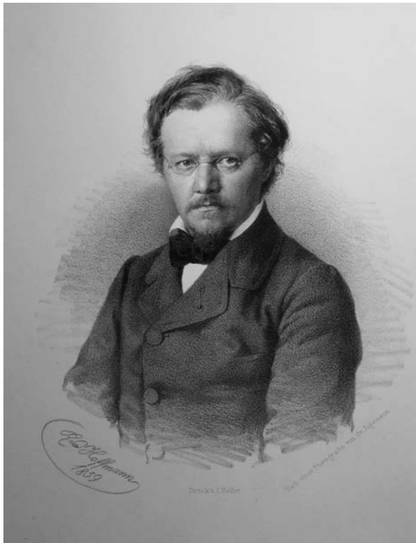
Fig. 1: Rudolf Kner (1859), lithography by Rudolf Hoffmann.

Bereits am 21.09.1843 konnte Kner bei der 21. Versammlung deutscher Naturforscher und Ärzte in Graz Kreide-Versteinerungen aus der Gegend von Lemberg vorlegen (Langer & Schrötter 1844: 118), die