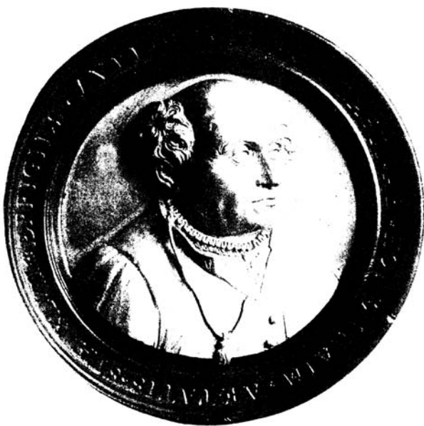
Abb. 4: Paracelsus. Porträtmedaille. Bronze, vergoldet. 17. Jh.

Wie zur Wertung von Person und Leistung wird hierzu ebenfalls kontrovers diskutiert. Über Jahrhunderte lagen die Annahmen zum Entstehungsjahr etwa zwischen 1533 und 1538. Demnach