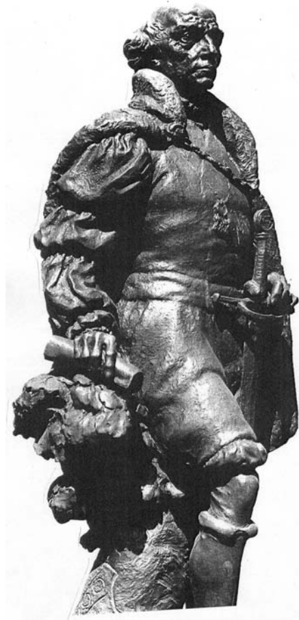
Abb. 2: Statue des Paracelsus in Ferrara

Auch in dieser Zeit und in diesem Gebiet zeigte sich seine Volksnähe, die sich wohl weniger in seiner deftigen Sprache als mehr schon im sozialen Empfinden äußerte. Der alpenländische Bauernkrieg