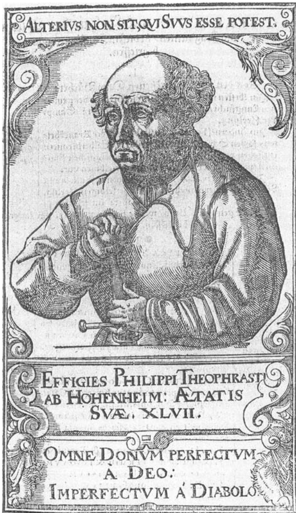
Abb. 1: Paracelsus. Porträt in den Bänden der Gesamtausgabe von Joh. Huser. 1589