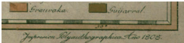
Abb. 3: Gimbernats Angabe zur Drucktechnik außerhalb der Randleiste, rechts unten.