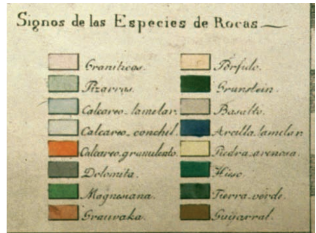
Abb. 6: Legende zu den lithologischen Einheiten in der Karte.

Die Farbgebung der handkolorierten Karte orientiert sich ein wenig an den Vorgaben Abraham Gottlob Werners, zugleich aber auch an den Empfehlungen Goethes für Keferstein (Steiner, 1981; Tab. 2). Mit Werners neptunistischen Vorstellungen ging Gimbernat konform. Auch die forsche Art, mit der er sie verteidigte, erinnert an Werner (Gimbernat, 1808 c). Werner ist Gimbernat bei seinem Aufenthalt in Freiberg wohl begegnet. Ob er aber einen anhaltenden Kontakt aufbauen konnte, darf bezweifelt werden. Dazu war die Zeit gewiss zu kurz und damit ist ein regelmäßiger Besuch der Vorlesungen Werners durch