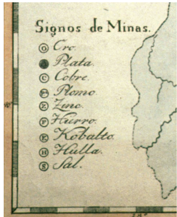
Abb. 7: Legende zu den Lagerstättensignaturen.