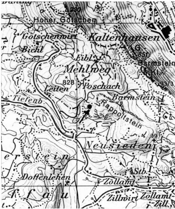
Abb. 1: Fundortskeizze; Ausschnitt aus dem Kartenblatt ÖK25V 93 Bad Reichenhall.

Stratigraphie: Hallstätter Kalk (Obere Trias: Nor)