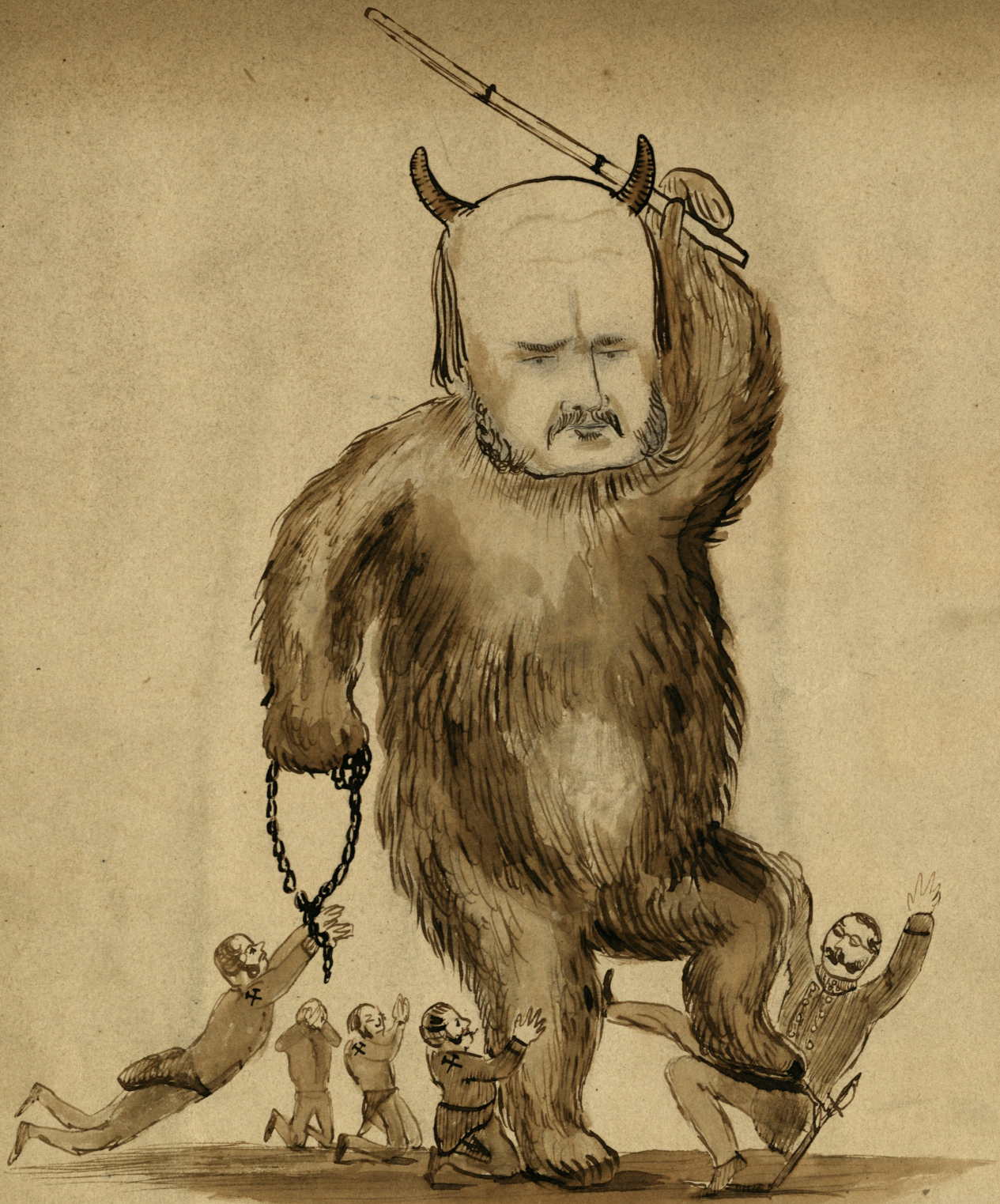
Der Chefredacteur des N. Fr. Figaro in seiner Mission als Montane Kämpfer.

Nur Poëibram kömmt mit Bambus Lammohr mit Horn und Horn Nun bald der Ober-Kämpfer, Zu streifen die Fingel mit Fingel Sei Pindor und bei Pindor; — Das kleinne wird das Großen Pindor er wird Pindor Nach Pindor in Leder gehen, Und erst ad posteriores Die Berggruß dort und more!