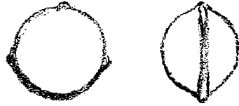
Fig. 2. Lepidocyclina sumatrensis . gr. 6 fois, d'après la figure originale de Brady.

Lep. sumatrensis , bien figuré par BRADY, a été quelquefois mal interprété. Cette espèce est remarquable par sa forme presque sphérique et par la collerette qui marque la région équatoriale et qui est presque toujours brisée. J'ai pu examiner un grand nombre d'échantillons provenant d'Hiligara, et communiqués par M. VERBEEK; il est facile de voir (pl. XX, fig. 7, 8, 9) que ces échantillons ont la surface couverte de petites pustules, mais en outre les