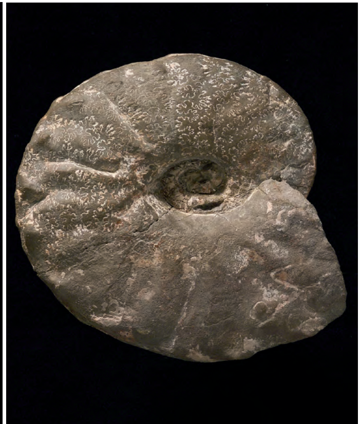
Abb. 9: Placenticerus paraplanum WIEDMANN, 1978, Mikrokonch, Obersantonium, Gosau, Oberösterreich, Abb. Orig. SUMMESBERGER 1979, Taf. 13, Fig. 53; Kollektion Skoumal, Wien; SK 1977/13; d 80 mm.