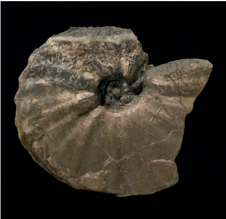
Abb. 2: Barroisiceras haberfellneri (HAUER, 1866), Strobl, Weißenbachtal, Salzburg; Abbildungsoriginal zu SUMMESBERGER & KENNEDY 1996, Taf. 6, Fig. 1; Taf. 10, Fig. 3; 82 mm.

Summesberger (in Vorbereitung) läuft parallel zum weltweiten explosionsartigen Kenntnisszuwachs, hervorgerufen durch Neufunde und Neubearbeitung in Japan, Madagaskar, Südafrika, Nord- und Südamerika, Australien und Antarktis, Deutschland, Frankreich, England, Spanien, Israel. Die weltweit zu jeder beschriebenen Art festgelegten Holotypen sind unabänderlich und dürfen nur in öffentlich zugänglichen Sammlungen aufbewahrt werden. Das oberösterreichische Paradestück ist der von REDTENBACHER 1873 beschriebene Ammonites isculensis aus Bad Ischl, aufbewahrt im Oberösterreichischen Landesmuseum unter dem Namen Eupachydiscus isculensis (REDTENBACHER 1873) und gefunden auf dem Kohlbüchl beim Bau der Straße von Bad Ischl nach Ebensee.