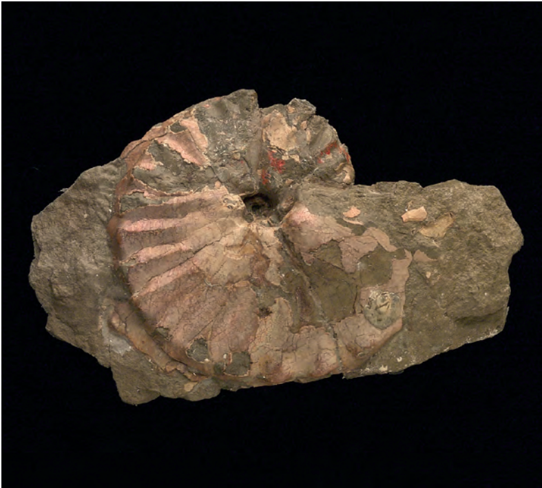
Abb. 1: Barroisiceras haberfellneri (HAUER, 1866), Gams b. Hieflau, Steiermark; GBA 3464; Lectotypus der Typusart; HAUER 1866, Taf. 1, Fig. 1; GBA 3464; d 63 mm.