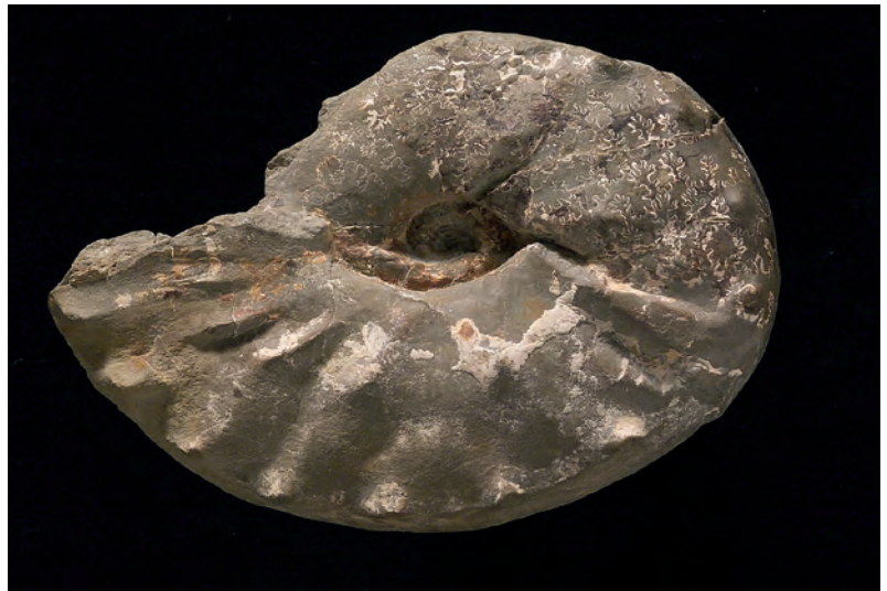
Abb. 7: Placenticerus polyopsis (DUJARDIN, 1837), Mikrokonch, Obersantonium, Gosau, Oberösterreich, Abb. Orig. SUMMESBERGER 1979, Taf. 10, Fig. 43; Kollektion Skoumal, Wien; SK 1977/4; d 89 mm.

Zwei ehemals weit voneinander entfernte Ablageungsgebiete mariner Sedimente der Oberkreide sind durch die Nord-Süd Raumverkürzung bei der alpinen Gebirgsbildung heute in Oberösterreich nahe benachbart: Die eher gleichförmig grauen bis bunten Mergel des Helvetikums und die differenzierten Sedimenttypen der Gosau Gruppe. Nachweise für die Evolution von Fossilien sind am ehesten an den merkmalsreichen Schalen der rasch evolvierenden marinen Ammoniten zu erwarten. Ihre meist spiralgig aufgerollte Schale tritt in erstaunlichem Formenreichtum auf. Ebenso vielfältig, von glatt bis berippt oder bestachelt, ist die Verzierung ihrer Schalen. Die oft überaus komplizierte Suturlinie dient gleichsam als „genetischer Code“ bei der Zuordnung zu höherrangigen systematischen Einheiten.