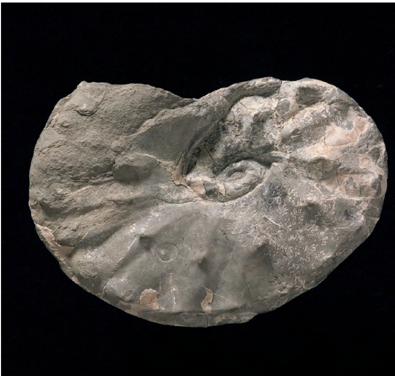
Abb. 6: Placenticerias polyopsis (DUJARDIN, 1837), Makrokonch, Obersantonium, Gosau, Oberösterreich, Abb. Orig. SUMMESBERGER 1979, Taf. 12, Fig. 48; NHMW1978/1963/5; d 104 mm.

tigen „Sandkalkbank“ stammen neben zahlreichen Bivalven und Gastropoden 22 Taxa Ammoniten, darunter über 100 Individuen der Gattung Placenticerias , die sich 3 wohldefinierten Arten zuordnen lassen: P. polyopsis (DUJARDIN, 1837) (= Stantonoceras depressum HYATT, 1903), P. paraplanum WIEDMANN, 1978b und P. maherndli SUMMESBERGER, 1979.