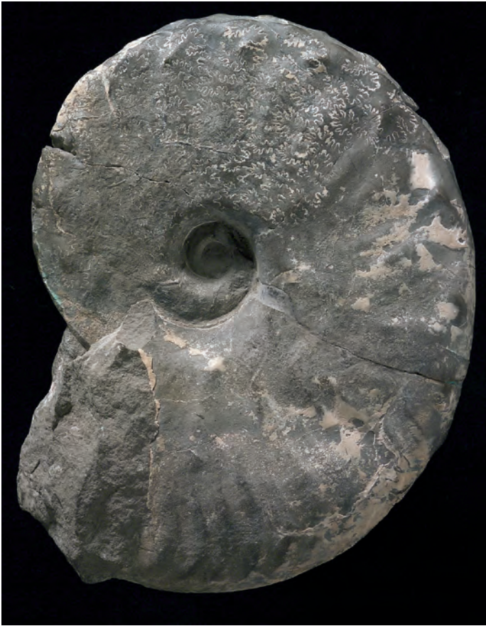
Abb. 10: Placenticerus maherndli SUMMESBERGER, 1979, Mikrokonch, Obersantonium, Gosau, Oberösterreich, Abb. Orig. SUMMESBERGER 1979; Holotypus; Taf. 14, Fig. 58, 59; Kollektion Maherndl, Bad Ischl; MA1977/2; d 94 mm.