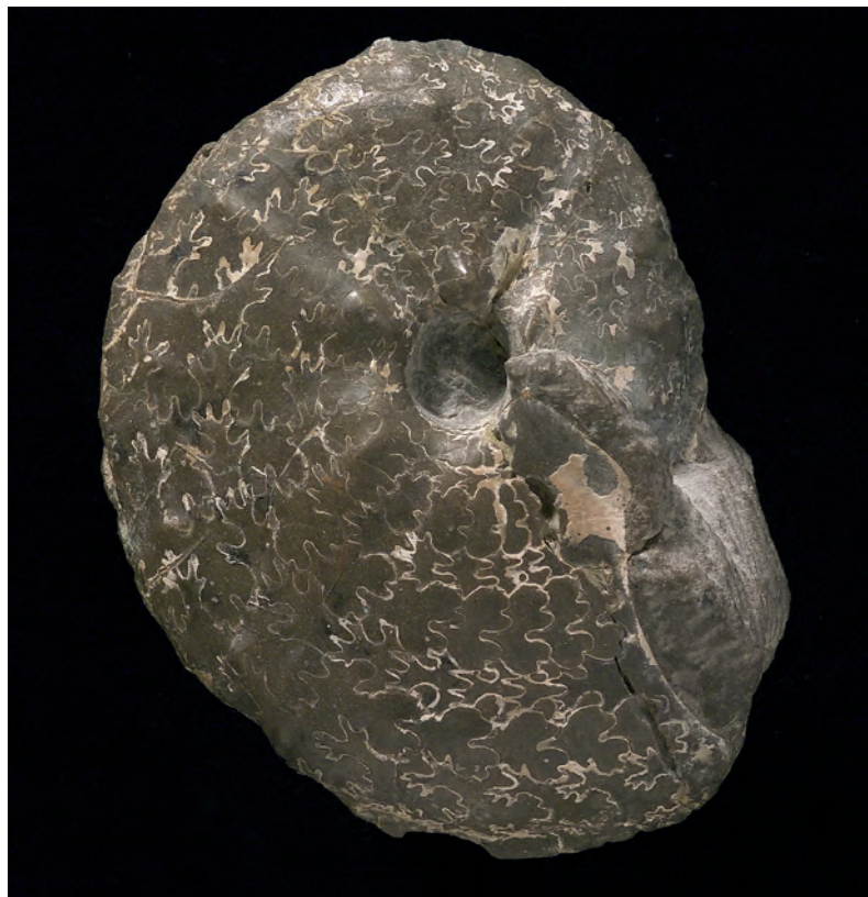
Abb. 4: Eulophoceras austriacum (SUMMESBERGER, 1979), Obersantonium, Gosau, Oberösterreich; Holotypus zu SUMMESBERGER 1979, Taf. 9, Fig. 37, 38; Kollektion Skoumal, Wien; SK 1977/14; d 76 mm.