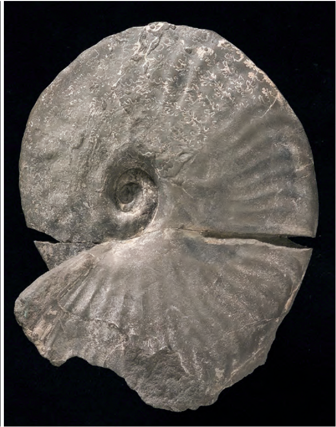
Abb. 11: Placenticerus maherndli SUMMESBERGER, 1979, Makrokonch, Obersantonium, Gosau, Oberösterreich, Abb. Orig. SUMMESBERGER 1979; Taf. 14, Fig. 60, 61; Kollektion Skoumal, Wien, SK 1978/4; d 88 mm.

bach tiefere Profilanteile vom Turonium bis ins Santonium erschließt. Aufschlüsse beim Forststraßenbau auf der oberösterreichischen Seite lieferten reiches Fossilmaterial aus dem oberen Santonium (SUMMESBERGER 1979, 1980). Profilvermessung und schichtweise Aufsammlung von Fossilien auf der oberösterreichischen Seite war vor der Verbauung auch im Grabenbach möglich. Mit Hilfe von Leitschichten im Gestein und wiedererkennbaren Fossilhorizonten wurde ein Gesamtprofil durch die Gosau Gruppe von Gosau rekonstruiert. Die horizontiert aufgesammelten Ammoniten wurden auf ihre Tauglichkeit als Indizienkette der Evolution geprüft.