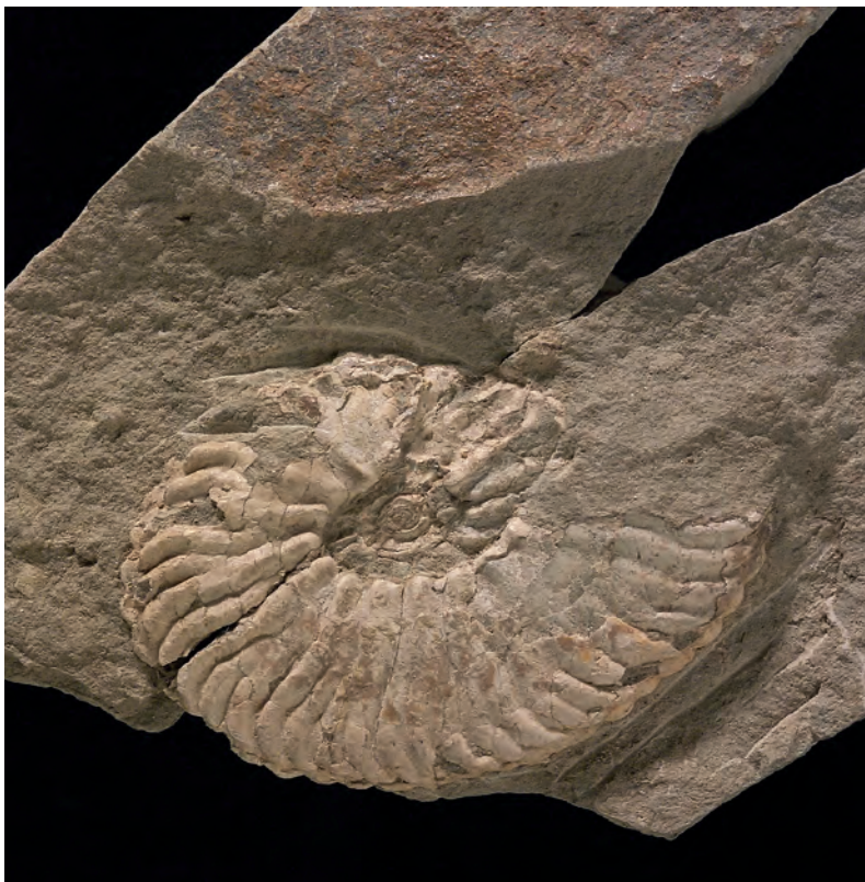
Abb. 3: Barroisiceras minimum HAYASAKA & FUKADA, St. Wolfgang, Oberösterreich; Abbildungsoriginal zu SUMMESBERGER & KENNEDY 1996, Taf. 16, Fig. 19, 20; NHMW 1992/245; d 29 mm.