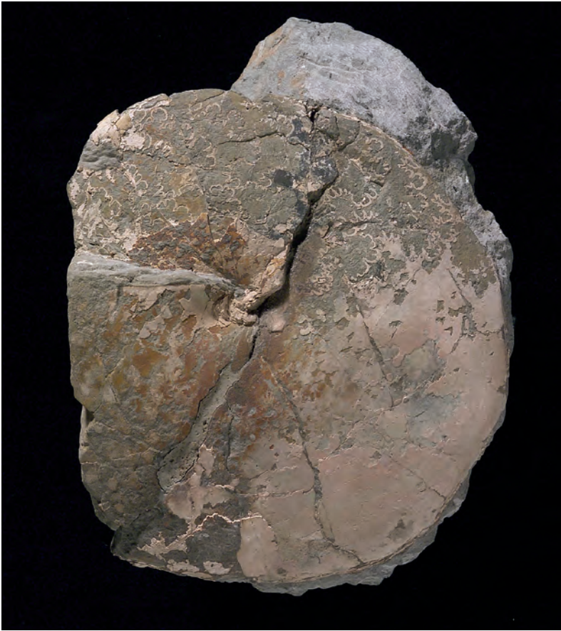
Abb. 5: Eulophoceras natalense HYATT, 1903, Untersantonium, Gosau, Oberösterreich; Kollektion Skoumal, Wien, SK/EB 1992/14; d 98 mm.