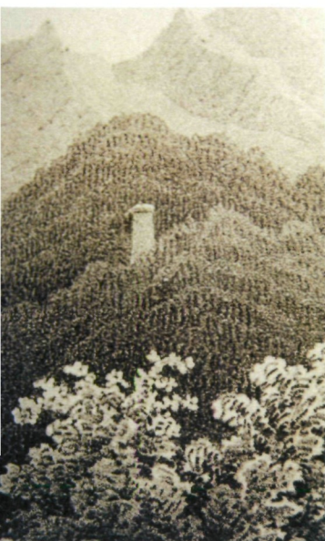
Abb. 5: Ausschnitt aus der Lithografie „Oberes Rosental“ von J. Wagner (1845), der Schrottturm liegt mitten im dichten Wald.

Schrottturm genutzt wurde, was zeitlich nicht ganz zusammenpasst. Anrainer denken sogar an einen ehemaligen Pulverturm.