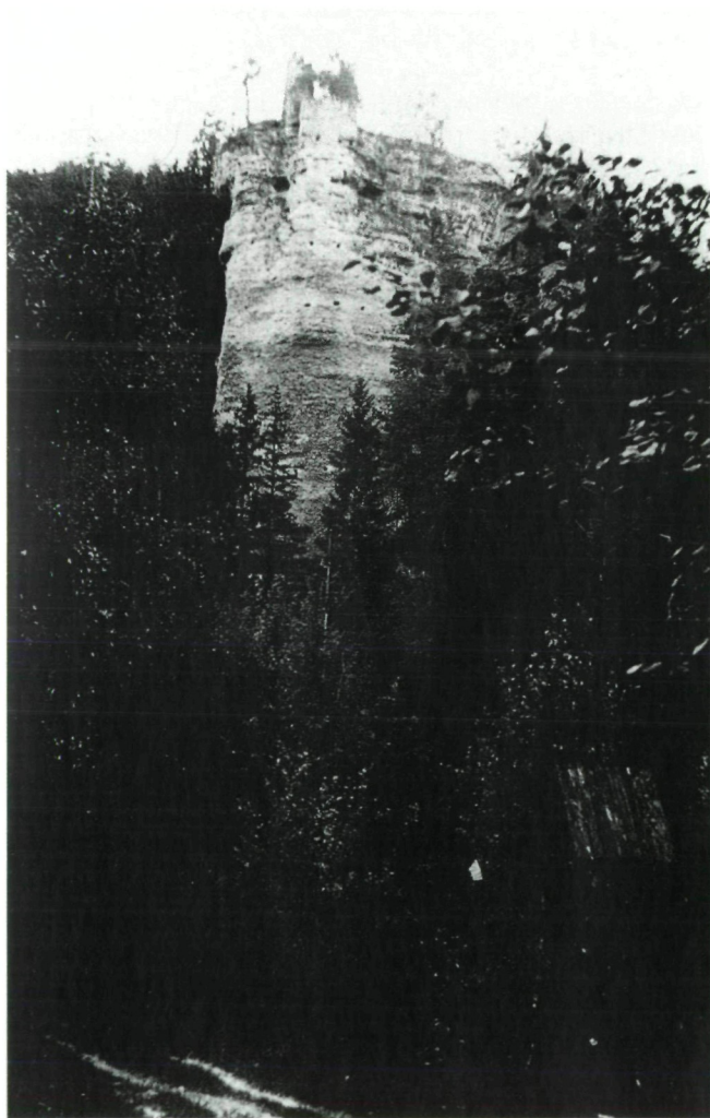
Abb. 6: Deutlich sind in der Felswand die Pfostenlöcher zur Sicherung des hölzernen Gießschachtes zu sehen. Der Schacht verhinderte nicht nur das Verwehen der Bleikugeln, sondern auch, dass die Bleitropfen bei Kälte erstarren, bevor sie die runde Form erhielten.

Im Franziszeischen Kataster aus 1827 findet sich die Eintragung „Schrottturm“ auf der Parz. 163, KG Tshedram, Gemeinde Maria Rain (an der Grenze zur Gemeinde Köttmannsdorf). Es ist hier knapp nördlich des Anwesens Adel im dichten Wald eine etwa 45 Meter hohe Felswand von Hollenburger Nagelfluh vorhanden, an deren Oberende sich 4 bis 5 m hohe, etwa 50 cm dicke Mauerreste finden. Zum Fußende führt ein noch heute deutlich erkennbarer Fahrweg, von einer Gießhalle ist nichts erhalten. Der Weg zum Fuße der Wand ist in den Hang eingekerbt. In den Mauerresten sieht man einige Pfostenlöcher einer Gießplattform, für Befestigungen des Gießschachtes etc.