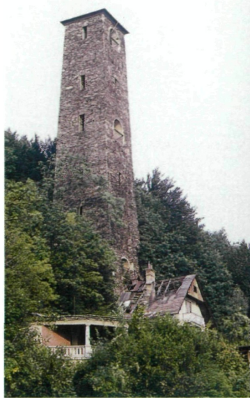
Abb. 3: Schrottturm Krumpendorf.