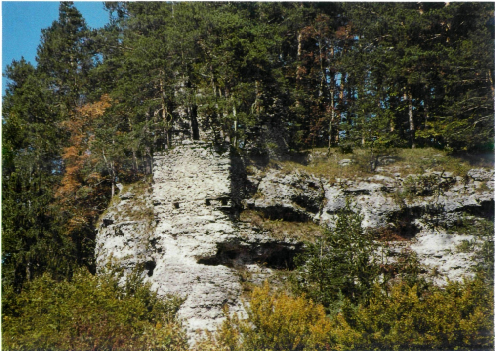
Abb. 8: Detailansicht von Mauerresten des Schrotturmes bei der Hollenburg. Foto: R. Gasper, 2004

Dass ein Turmbauwerk tatsächlich existierte, beweist eine Lithografie von J. Wagner (1845). Auf dem Blatt „Oberes Rosental“ ist an der fraglichen Stelle mitten im Wald zwar klein, aber einwandfrei erkennbar ein ca. 15 m hoher, viereckiger Turm mit Dach zu sehen. Es war also (einschließlich der Wand) eine für das Schrotgießen nutzbare Fallhöhe von rund 50 bis 55 Meter vorhanden.