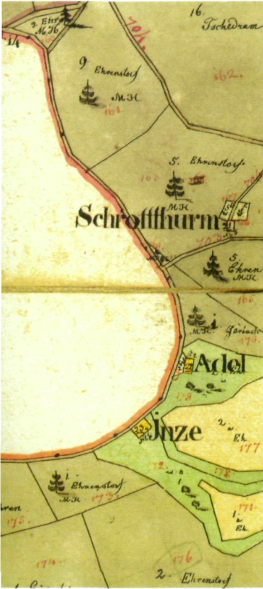
Abb. 9: Ausschnitt aus dem Franziszeischen Kataster mit dem Schrottturm Hollenburg und den Anrainern