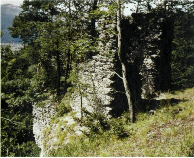
Abb. 7: Detailansicht von Mauerresten des Schrotturmes bei der Hollenburg.

Dass ein Turmbauwerk tatsächlich existierte, beweist eine Lithografie von J. Wagner (1845). Auf dem Blatt „Oberes Rosental“ ist an der fraglichen Stelle mitten im Wald zwar klein, aber einwandfrei erkennbar ein ca. 15 m hoher, viereckiger Turm mit Dach zu sehen. Es war also (einschließlich der Wand) eine für das Schrotgießen nutzbare Fallhöhe von rund 50 bis 55 Meter vorhanden.