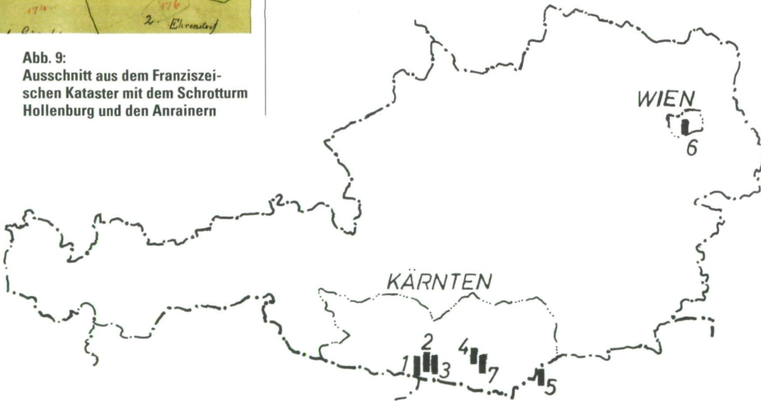
Abb. 10: Schrotttürme in Österreich