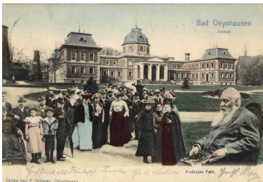
Abb. 6: Korrespondenzkarte mit Rudolf Falb im Rollstuhl vor der Thermo-solequellen-Heilanstalt Oeynhausen aus dem Jahr 1896.

Ab 1896 verschlechterte sich der Gesundheitszustand von Rudolf Falb dramatisch. Das hatte zur Folge, dass er – als freischaffender Wissenschaftler – sich Kuraufenthalte (Abb. 6) finanzieren musste, und zudem keine Vorträge halten konnte, die ihm die dringend nötigen Einkünfte gesichert hätten, um seine siebenköpfige Familie zu erhalten. Diese unglückliche finanzielle wie persönliche Situation fasste das in Stuttgart erscheinende illustrierte Unterhaltungsblatt „Über Land und Meer“ anlässlich des bevorstehenden (vermeintlichen) 26 60. Geburtstages von Falb treffend zusammen, in dem es meinte, „ dass das Leben des Jubilars ein andauernder Kampf gewesen [sei]: der innere, gewiß schwere Kampf des geweihten Priesters mit dem Manne der Forschung, dann das harte Ringen um die Existenz, der immer erneute Kampf mit körperlichen Leiden und der unaufhörliche Streit mit den wissenschaftlichen Gegnern. “ 27