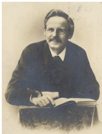
Abb. 1: Foto von Peter Rosegger auf einer Korrespondenzkarte.