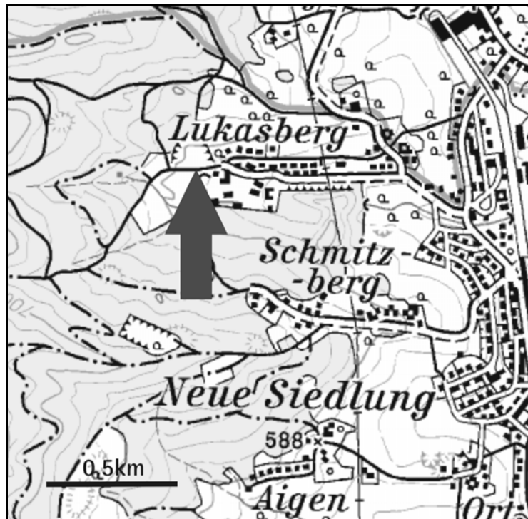
Abb. 9: Lage des Tagbaus Lukasberg bei Ampflwang.

Thema: Kohletonserie s.str. (Kohleführende Süßwasserschichten, Pannonium).