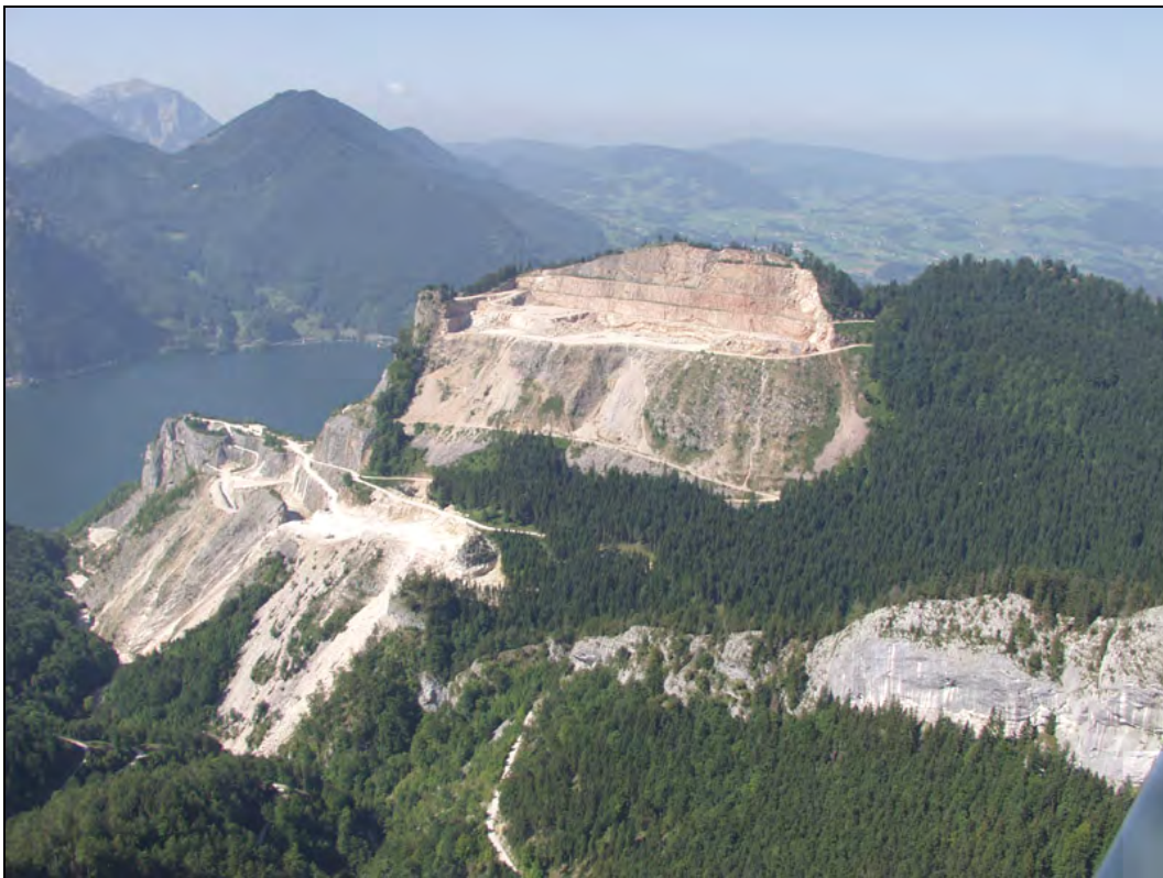
Abb. 1: Aus 2003: Übersicht über die Abbaue „Hochlindach“ und „Alter Abbau“.

Während der „Alte Steinbruch“ in seiner Anlage direkt dem schmalen Streifen des Plassenkalkes folgt, ist die Geologie im nördlichen Steinbruch äußerst kompliziert. Sie stellt eine der regionalen Streichrichtung folgende, steilstehende Aufwölbung der Trias-Unterlage aus Dachsteinkalk dar. An ihren Flanken streichen, teilweise tektonisch zerstückelt, Hierlatzkalk und die Kalkbreccie der Grünanger-Formation mit überlagerndem Tressensteinkalk im Süden und Oberalmer Schichten im Norden aus. In der Depression zwischen den beiden Steinbrüchen sind, leichter erodierbar, die Gosausedimente an Störungen eingeschaltet. Abgebaut werden im Steinbruch „Hochlindach“ alle Kalksteine mit Ausnahme der Hornstein führenden Oberalmer Schichten, da deren Quarz-Gehalt extrem störend ist. Dadurch wird ein \text{CaCO}_3 -Gehalt von ca. 96% erreicht. Plassenkalk ist somit in diesem Bruch nicht vorhanden, jedoch finden sich auch innerhalb des Bruches immer wieder Einlagerungen von Gosauschichten etc. Die Gesteine aus Obertrias, Jura und Kreide sind stark verschuppt. Prognosen und Planungen sind dadurch äußerst schwierig.