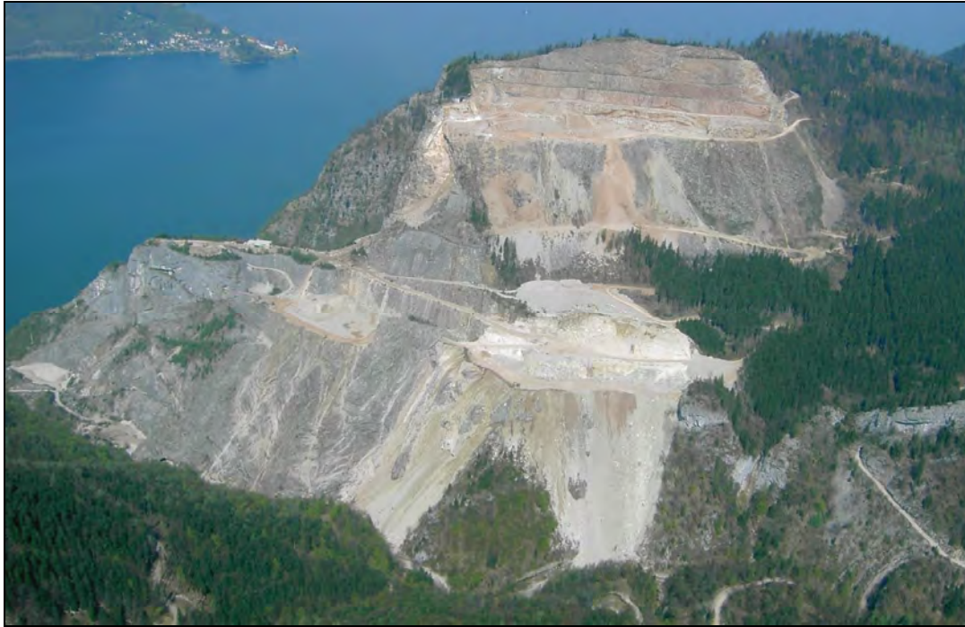
Abb. 2: Steinbruch Karbach 2006. Hingewiesen wird auf folgende Änderungen gegenüber 2003: weiter fortgeschrittener Abbau mit der tiefer eingezogenen Etage im Südosten (Alter Abbau; Grenze zwischen Unterlagerung und Plassenkalk [weiß]) und sanierte Kulisse am unteren Westrand des Abbaues Hochlindach.