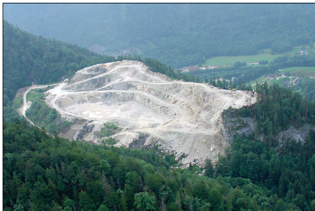
Abb. 4: Die Luftaufnahme des Steinbruches aus Nordwestrichtung vom Sommer 2005 zeigt, dass mit Ausnahme der Ostseite alle Schichten gleichermaßen verwendet werden können und daher der Abbau vor allem gegen Süden und Westen fortschreitet.