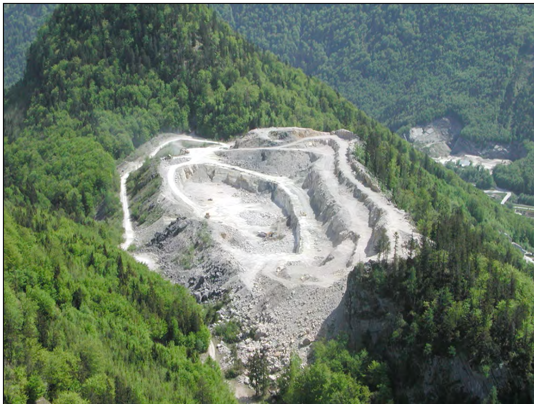
Abb. 3: Abbauzustand vom Mai 2003 des Steinbruches Starnkogel in West-Ost-Ansicht, im Hintergrund Kalkwerk mit altem Steinbruch in Rettenbach.