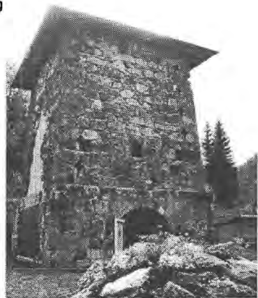
Abb. 20: Restaurierter Hochofen der 1891 stillgelegten Marien-Hütte.

Zur Bergbaugeschichte siehe A. WEISS (S. 164 ff., dieser Band).