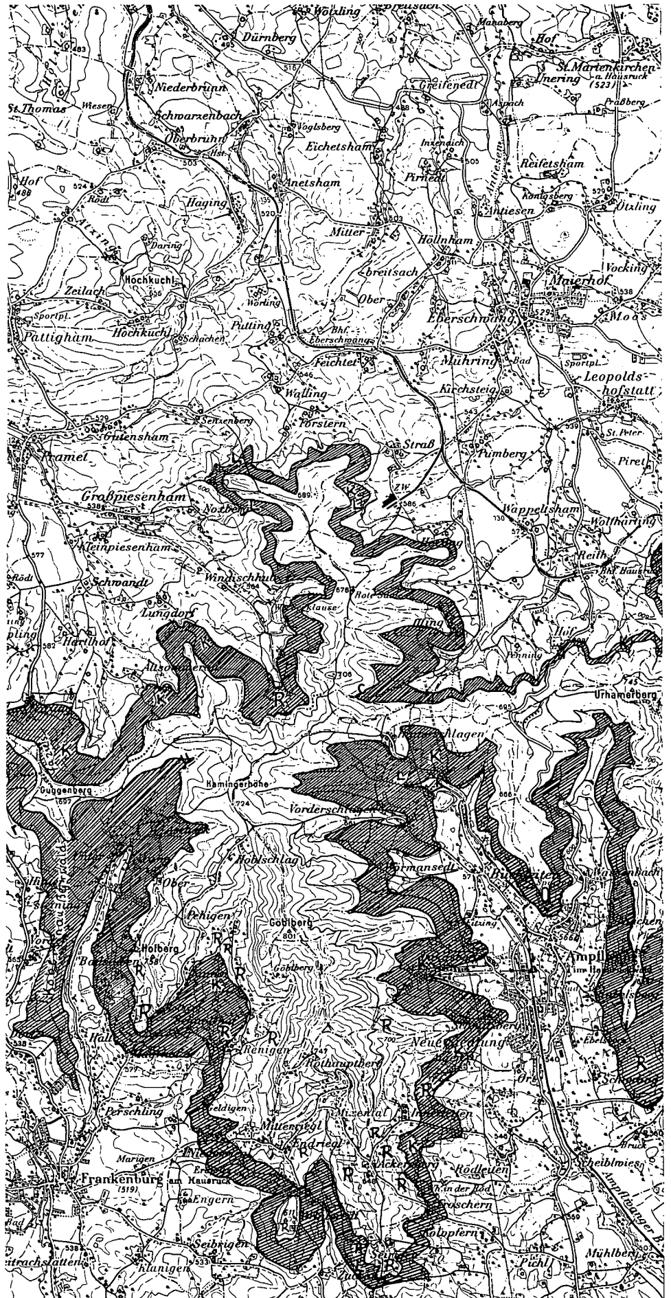
Abb. 1. Ausbiß der Kohleführenden Süß- wasserschichten im Hausruck, überschottert (schraffiert). K = Kohleausbiß; L = Liegend- schichten; R = größere Rutschgebie- te. ————— = 1 km.