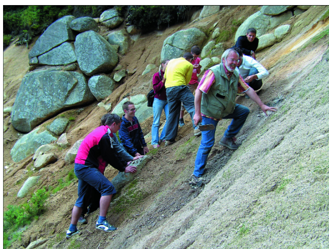
Abb. 1. Die „Erlebbarkeit mit allen Sinnen“ an Geopark-Aufschlüssen erleichtert die Vermittlung der Woll sackverwitterung im Harz.

Im Tätigkeitsfeld der öffentlichen Planung gibt es seit langem einen institutionalisierten und kontinuierlichen Kommunikationsprozess, an welchem sich Theoretiker und Praktiker gleichermaßen beteiligen, beispielsweise in der Akademie für Raumforschung und Landesplanung oder der Deutschen Akademie für Landeskunde. Es wurden und werden fortlaufend aktuelle räumliche Entwicklungen beobachtet, Methoden der Analyse hinterfragt und weiter entwickelt, Prognoseverfahren und Prognoseergebnisse diskutiert und Instrumente überprüft und erneuert. So wie die Geologie ohne die kontinuierliche Forschung seit Jahrzehnten auf der Stelle treten und an gesellschaftlicher Relevanz verlieren würde, gilt das auch für alle sozialwissenschaftlichen Disziplinen und die Planung.