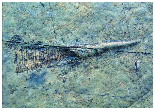
Abb. 5. Orthoconer Cephalopode in den kieseligen Übergangsschichten (Länge 10 cm).