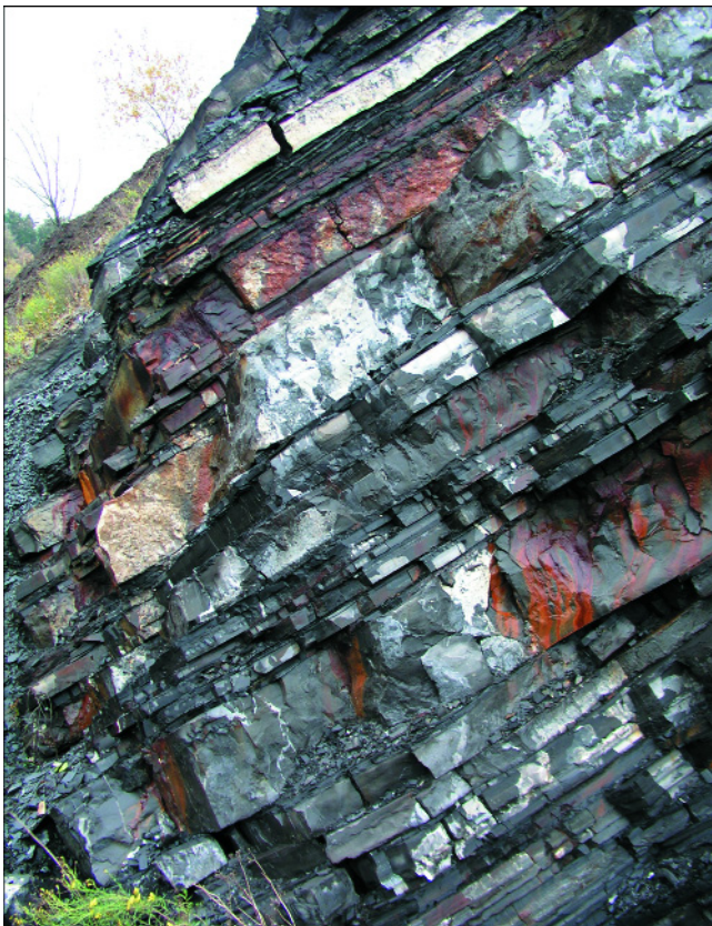
Abb. 3. Typische Kalksteinbänke der Schichtenfolge im Steinbruch Becke-Oese.

Im Hangenden dieses Horizontes erreichen die Bankmächtigkeiten der Kalkturbidite bis zu 80 cm. Den Bereich zwischen Actinopterien-Schiefer und Einsetzen der Hangenden Alaunschiefer trennt KORN (2003) als Edelburg-Subformation ab.