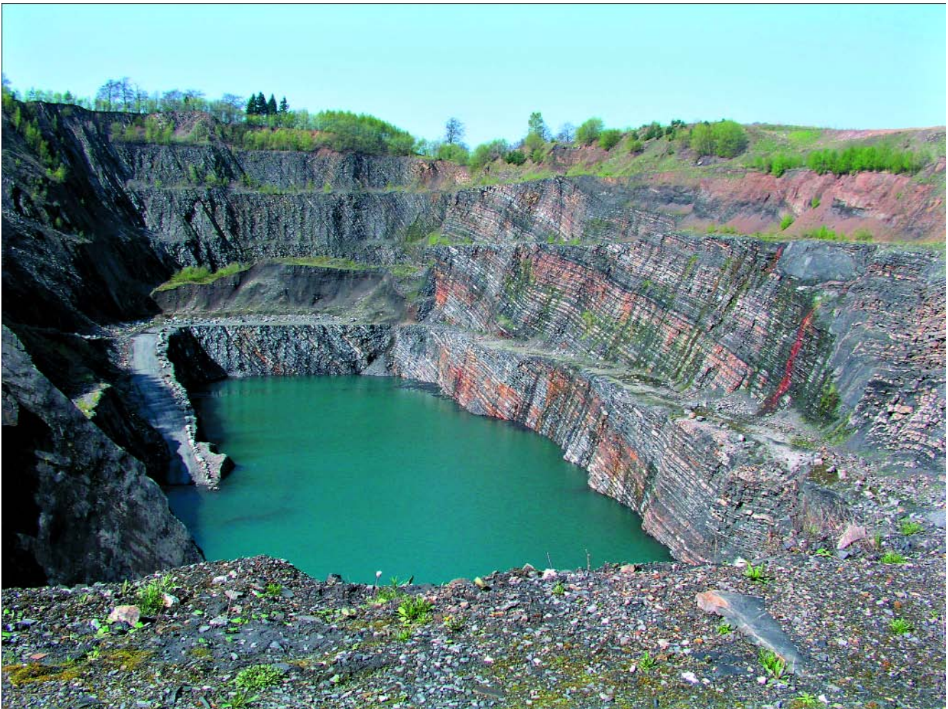
Abb. 2. Blick auf den Steinbruch Becke-Oese in westliche Richtung.

Mehr als 100 Jahre wurde im Steinbruch Becke-Oese Kalkstein gebrochen. Ursprünglich begann der Abbau in den Kulm-Plattenkalken unmittelbar an der Straße von Hemer nach Menden. Heute liegt das Ende des Steinbruchs ca. 900 m westlich der Straße. Bedingt durch die etwa 20–40 cm dicken Kalksteinbänke und ein orthogona-