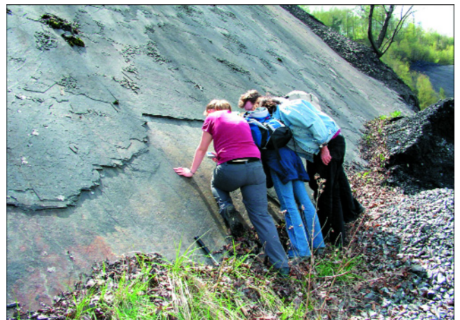
Abb. 4. Eine Gruppe von Studenten bei der Bestimmung von Fossilien.