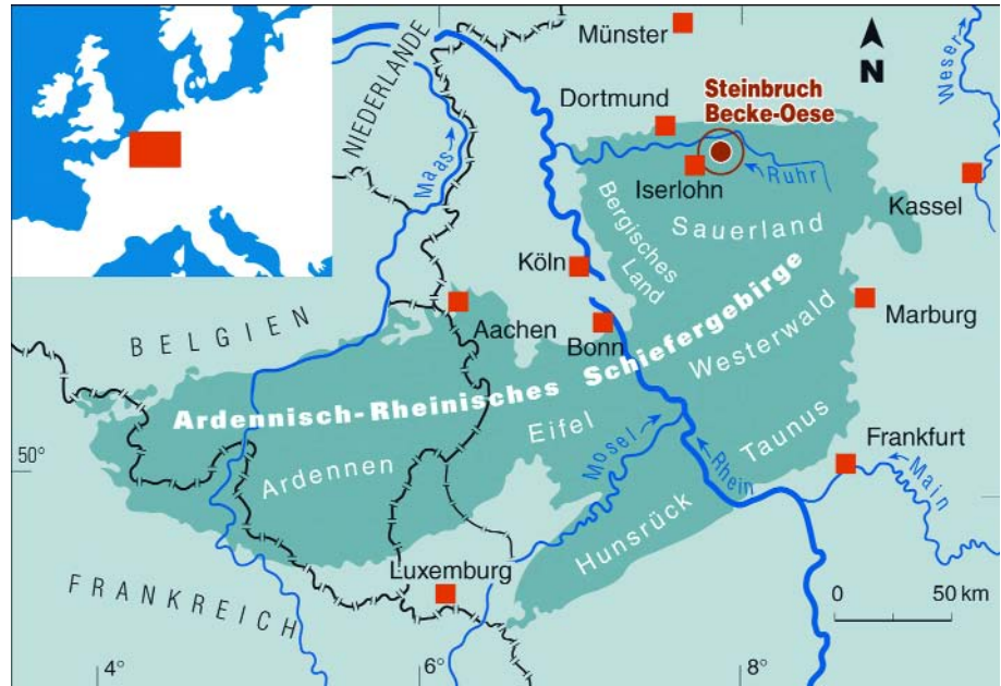
Abb. 1. Lage des Steinbruchs Becke-Oese.

bon). Nicht weit vom Steinbruch, an der Straße in Richtung Hemer befindet sich die Devon/Karbon-Grenze.