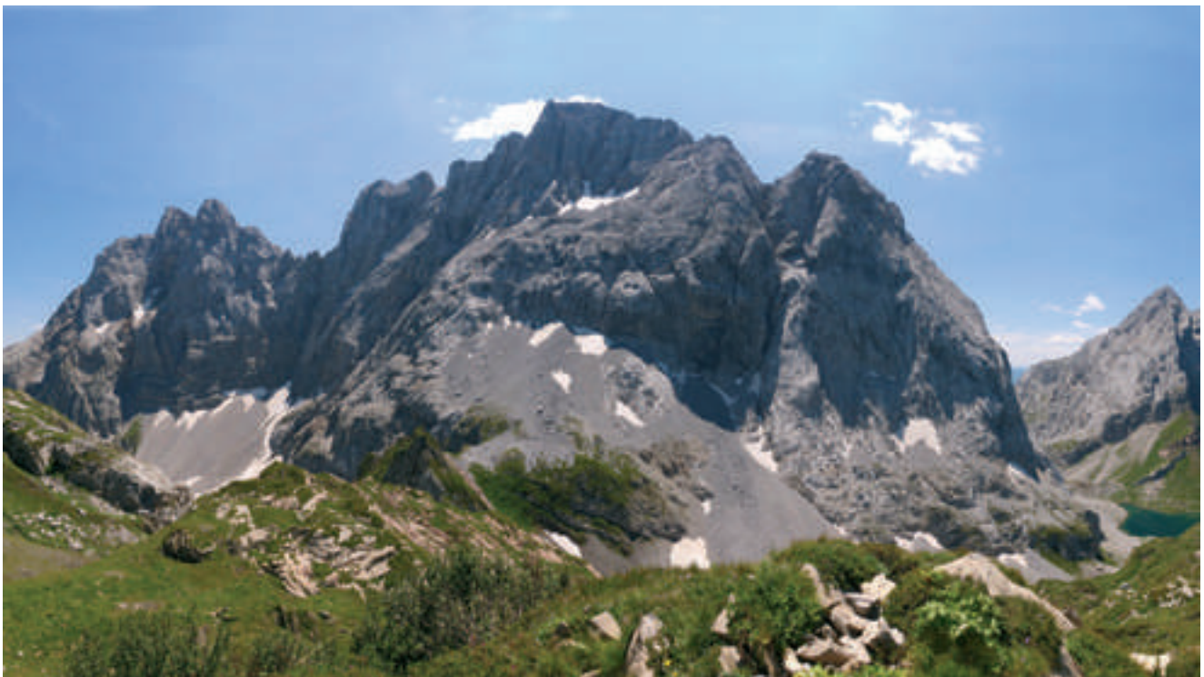
Fig. 8 - View from North of the Kollinkofel (Creta di Collina) and Kellerspitzen (Creta della Chianevate). Photo I. Pecile. - Vista da Nord della Creta di Collina e Creta della Chianevate, Foto di I. Pecile.

Manuscript received on 24.VIII.2019, accepted on 17.IX.2019.