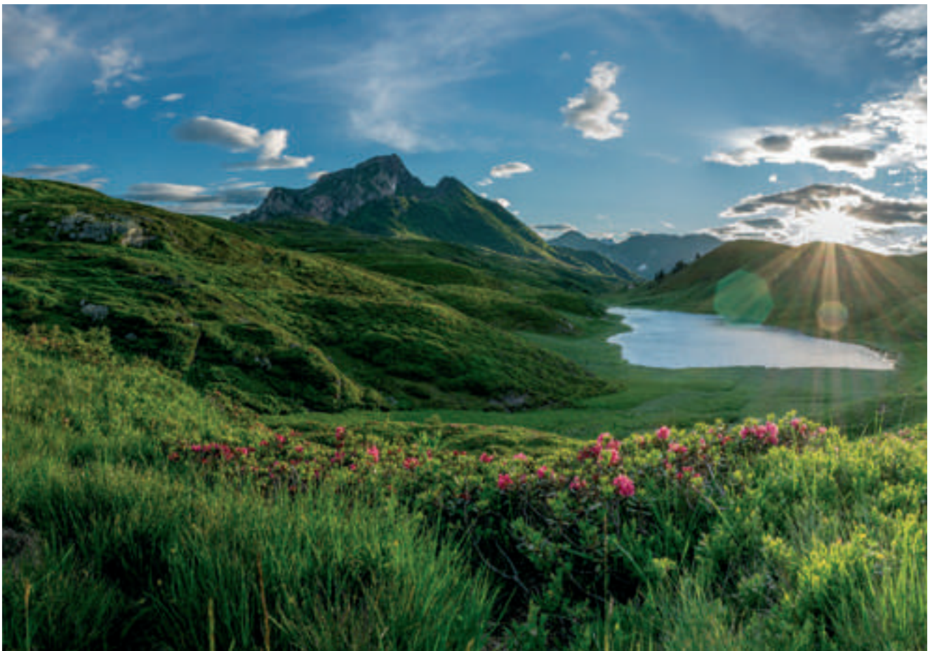
Fig. 5 - Lake Zollner. - Lago di Zollner.

KAHLER & KAHLER 1966, 1980, 1982 (fusulinids); KAHLER & KRAINER 1993 (fusulinids); KAISER & CORRADINI 2011 (conodonts); KODSI 1971 (corals); KORN 1992 (ammonoids); KOZUR et al. (conodonts); KRAINER & VACHARD 2014 (foraminifera, algae); KRAINER & VACHARD 2007a, 2007b (algae), KRAINER et al. 2019a (foraminifera); KRAINER et al. 2019b (algae); KRATZ 1989 (trilobites); LEPPIG et al. 2005 (fusulinids); LUPPOLD 1994 (conodonts); KRISTAN-TOLLMANN 1971 (foraminifera); KŔIŽ 1974, 1979, 1999; KÜSTER 1987 (corals); LANGER 1969 (foraminifera); MARTIN 1978 (acritarchs); MEHL & NOÉ 1990 (foraminifera); OEKENTORP-KÜSTER & OEKENTORP 1992 (corals); PERRI & SPALLETTA 1988a, 1988b (conodonts); PFEIFFER 1988 (conodonts); PICKETT 2007 (corals); PLODOWSKI 1971, 1973 (brachiopods); POHLER et al. 2007 (stromatoporoids, corals); PÖLSLER 1969b (conodonts); PRIEWALDER 1987 (acritarchs); PRIEWALDER 1997, 1999, 2000 (chitinozoans); RISTEDT 1968 (nautiloids); RODRIGUEZ et al. (corals); SAMANKASSOU 1998 (algae); SANTEL 2001 (trilobites); SCHALLREUTER 1990 (ostracods); SCHNEIDER 1989 (trilobites); SCHÖNLAUB 1969b, 1971a, 1980, 1985a, 1994, 2018 (conodonts); SCHÖNLAUB & FLAJS 1993 (corals, stromatoporoids); SCHÖNLAUB & KREUTZER 1993 (conodonts); SCHÖNLAUB