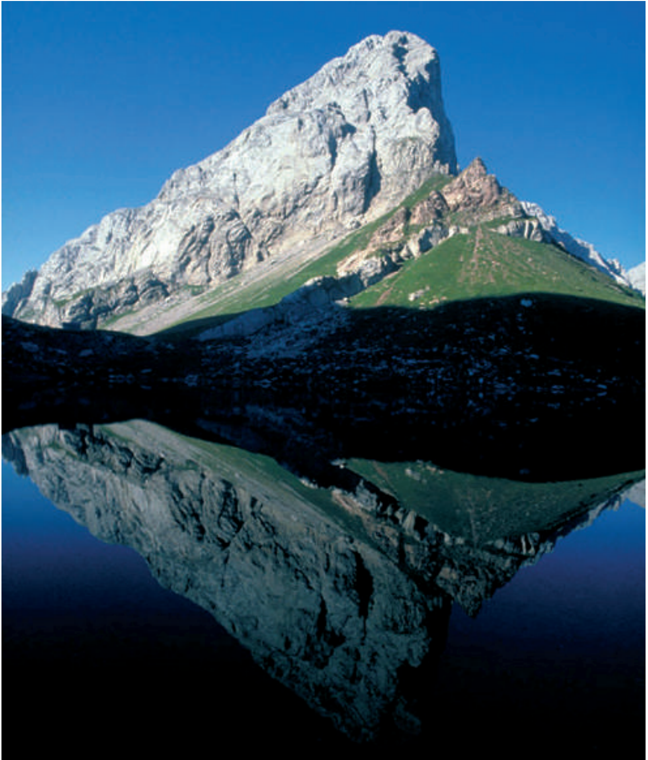
Fig. 6 - Lake Wolayer (Wolayersee) with Mt Seekopf (2554 m). - Il Lago di Volaia con il Monte Capolago (2554 m).

Paleozoic Seas Symposium, Graz, 14 th -18 th September 2009 (eds SUTTNER, HUBMANN & PILLER). Abstract