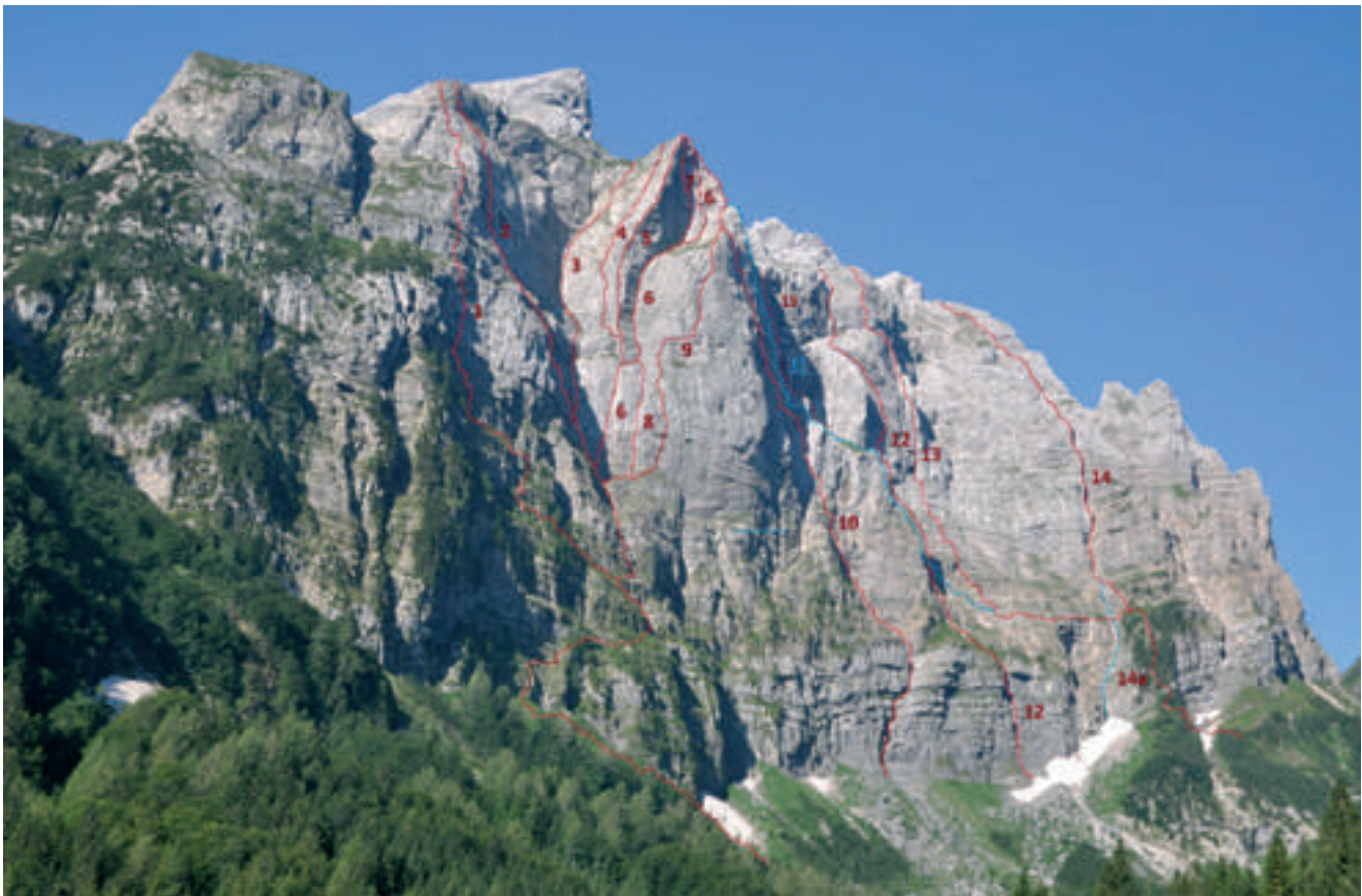
Fig. 3 - The Kellerwand cliff (Ordovician to Devonian). Indicated are climbing routes by R. Ranner & friends.

al. 1976, 1994; BUTTERSACK & BOECKELMANN 1984; CORRADINI & SUTTNER 2017; CORRADINI et al. 2015c, 2015d, 2015e; DEROO et al. 1967; DULLO 1992; DULLO & SCHÖNLAUB 2012; EBNER 1973a; EDWARD & RIDING 1989; FELSER 1974; FENNINGER 1970, 1971, 2000; FENNINGER et al. 1971, 1976, FENNINGER & STATTEGGER 1977; FERRETTI 2005; FERRETTI & HISTON 1997; FERRETTI & SCHÖNLAUB 2000; FERRETTI et al. 1999, 2004, 2012a, 2012b, 2013, 2015a, 2015b, 2015c; FLÜGEL E. 1968, 1969, 1971, 1974, 1977, 1980, 1987; FLÜGEL E. & AGIORGITIS 1970, FLÜGEL E. et al. 1971, 1978, 1994, 1997; FLÜGEL E. & KAHLER 1974; FLÜGEL E. & KRAUS 1988; FLÜGEL E. & SCHÖNLAUB 1990; FLÜGEL H.W. 1969; FLÜGEL H.W. et al. 1977; FOHRER & SAMANKASSOU 2005; FORKE 2009; FORKE & SAMANKASSOU 2000; FORKE et al. 2006, 2008; GÖDDERTZ 1982; HEINISCH 1981; HERMANN 2017; HERZOG 1988; HINDERER 1992; HISTON et al. 2007; HOMANN 1968, 1969, 1970; HÜNEKE 2001, 2006; JEPSSON et al. 2012; KAHLER 1971, 1972, 1980a, 1980b, 1992; KALDE 1987; KIDO, ed at. 2012, 2015; KRAINER 1990, 1991, 1992, 1995a, 1995b, 2012; KRAINER & LUTZ 1995; KRAINER et al. 2003, 2009, KRAINER & SCHAFFHAUSER 2012; KRAFT, 1997; KREUTZER 1990, 1992a, 1992b; Kofíř et al. 2003; LÄUFER et al. 1997, 2001; LEDITZKY 1973, LOESCHKE & HEINISCH 1993; MANARA