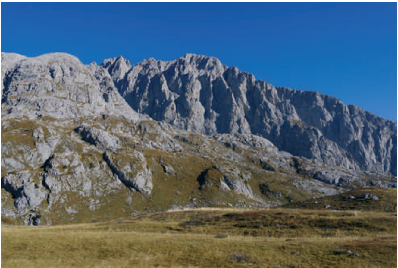
Fig. 7 - The area between Forcella Monumenz, Cima Plotta and Cra. Monumenz. Photo A. D'Andrea. - Larea fra Forcella Monumenz, Cima Plotta e Casera Monumenz. Foto di A. D'Andrea.