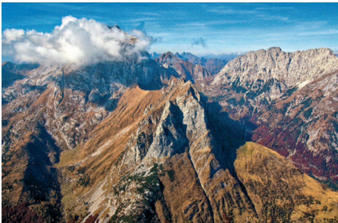
Fig. 2 - Aerial view from Mt Kleiner Pal towards northwest, in the foreground Cellon avalanche gully, in the background Gamskofel massif and Mt Rauchkofel (centre). - Vista aerea dal Pal Piccolo verso nordovest. In primo piano il canale di valanga con al sezione del Cellon (Creta di Collinetta), sullo sfondo il massiccio del Gamskofel e il Rauchkofel (al centro).

In addition to these 'official geological maps' several maps accompanying geological thesis and master studies were accomplished during the last decades and add considerably to the knowledge of the Austrian part of the Carnic Alps. They were integrated into the official maps to a varying degree.